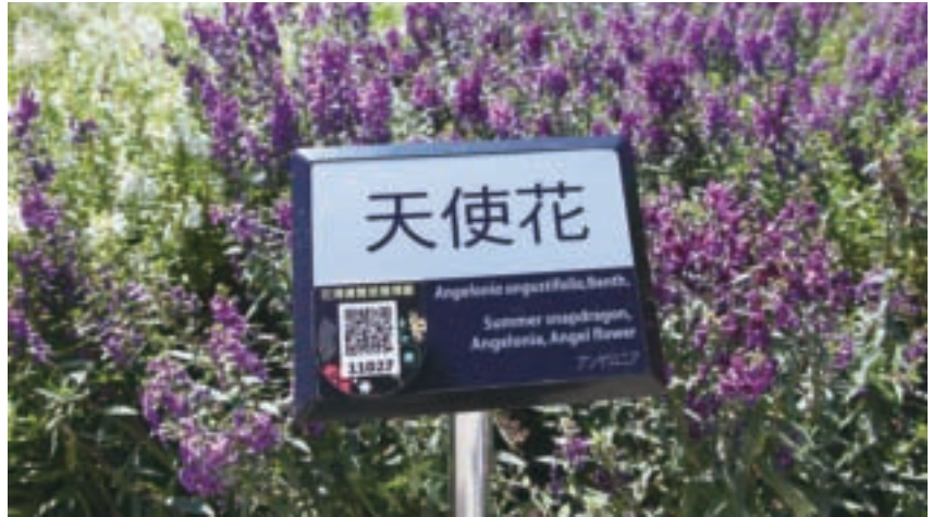
部分植栽立牌設有感應標籤，可用手機連結上網，瀏覽詳盡資訊。