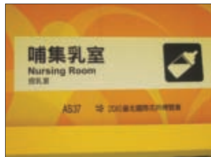
哺集乳室免費提供熱水供沖泡奶粉。