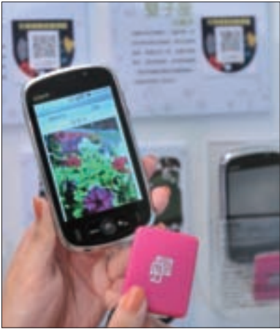
遊客可免費租借中華電信提供的導覽手機與智慧感應器，深度遊花博。