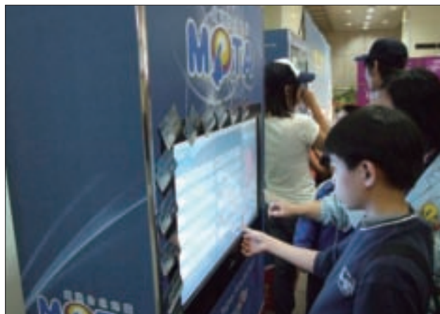
不妨利用MOTA機台查詢花博旅遊情報。

善加利用手機下載花博服務，以及花博園區內的導覽服務，讓遊逛花博更有深度、更加精彩。