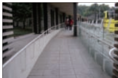
多數展館均規劃無障礙參觀動線，如設置無障礙坡道方便輪椅、嬰兒車行進。