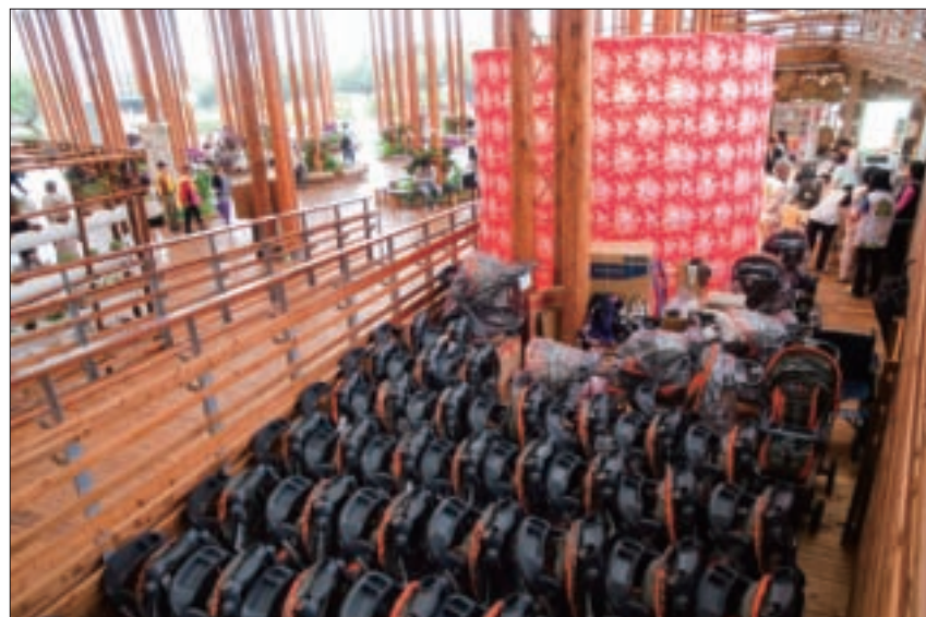
花博新生公園區貼心準備嬰兒車，供有需要的遊客洽借。

以國際化的高規格布展，卻以在地的溫情貼近每一個人的心。因為抱持同理心，所以貼心；因為總是設身處地為你著想，所以倍感窩心！美麗的花卉朵朵綻放在你我的心田裡，臺北花博會以友善的環境與無盡的熱誠迎接你前來共襄盛舉！