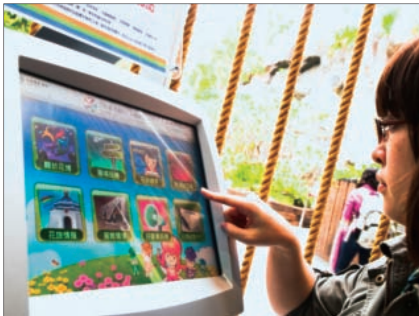
觸控式的多媒體資訊站，操作十分簡易。

參觀花博，除了欣賞各式花卉植栽所展現的力與美，更要知道花草們的生態常識；除了用雙眼觀賞建築、用雙手體驗科技，還有許多故事等著你聆聽。在踏入花博園區之前，不妨透過智慧型手機查詢或下載花博相關服務，事先規劃花博行程，進入園區後，可藉由手機導覽服務與多媒體資訊台，認識花博、瞭解花的故事。