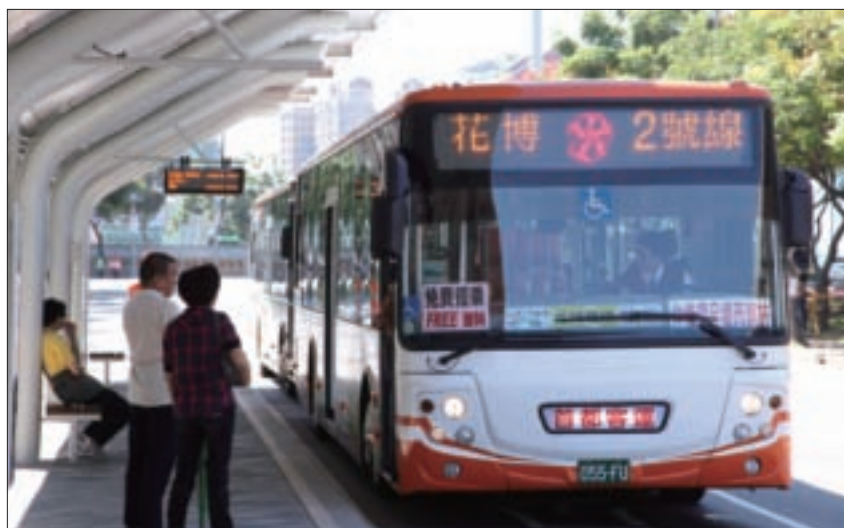
花博各園區皆設有免費接駁車，方便參觀民眾。