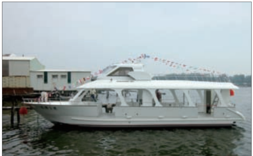
搭船遊花博，是最新潮的遊園方式。