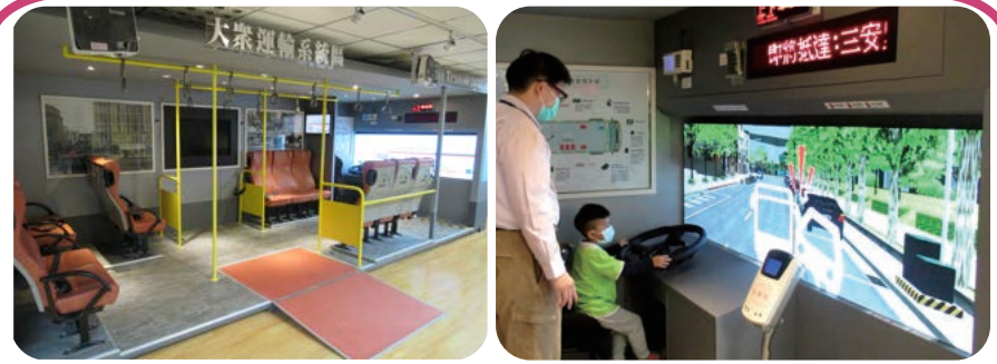
擔任公車駕駛，認識視野死角，原來司機真的看不到，避免接近大型車