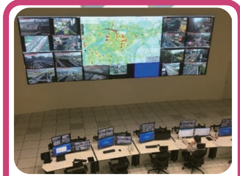
一睹順暢交通的幕後管制功臣