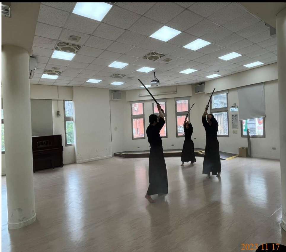
日期：112年11月17日 場地：3樓