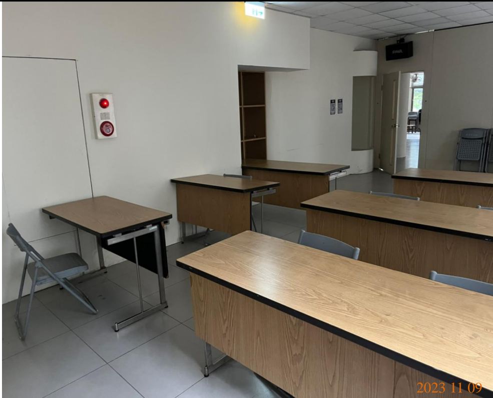
日期：112年11月9日 場地：2樓