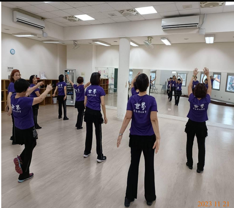
日期：112年11月21日 場地：3樓