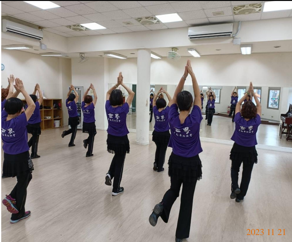
日期：112年11月21日 場地：3樓