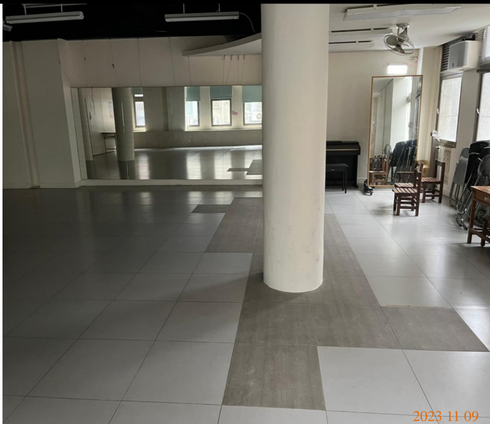
日期：112年11月9日 場地：2樓