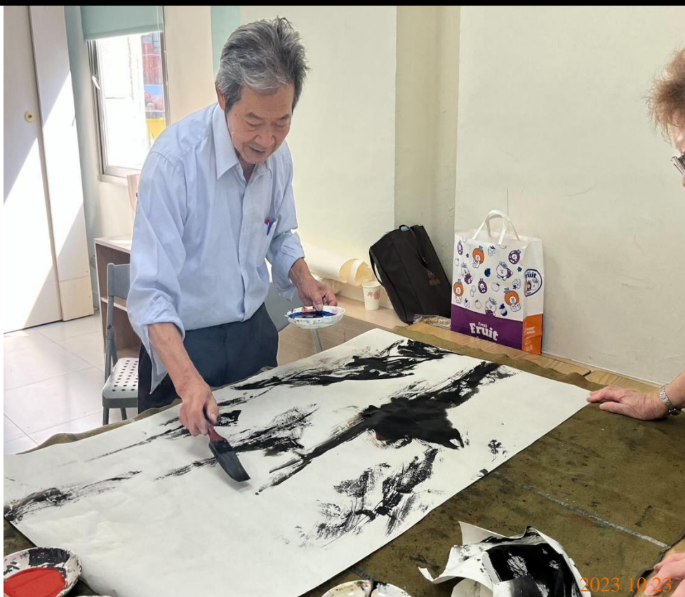
日期：112年10月23日 場地：2樓