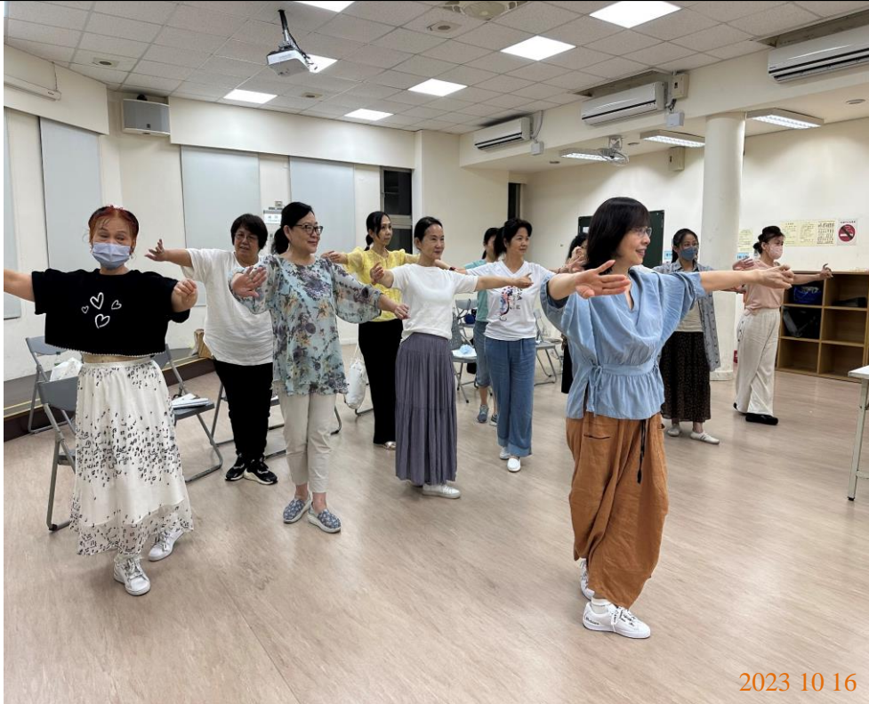
日期：112年10月16日 場地：3樓