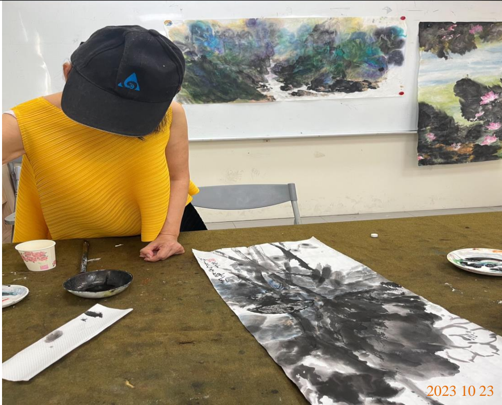
日期：112年10月23日 場地：2樓