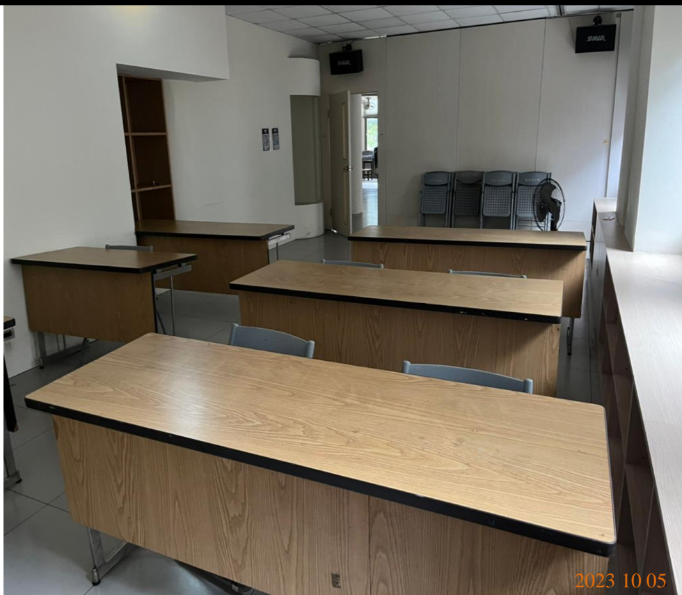
日期：112年10月5日 場地：2樓