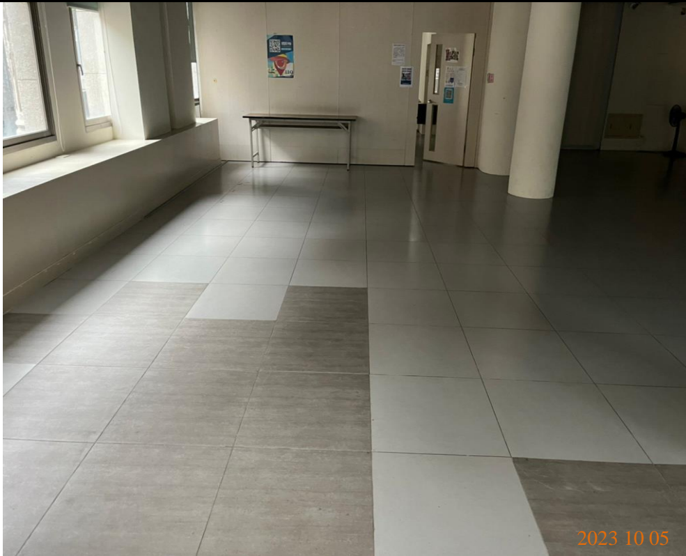
日期：112年10月5日 場地：2樓