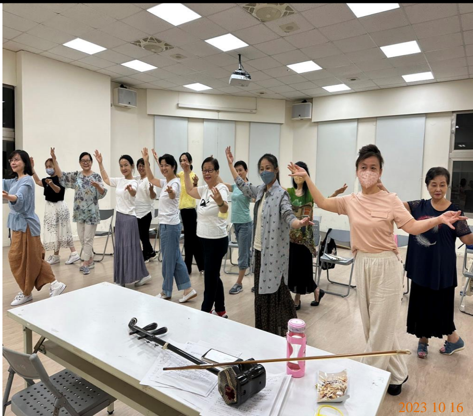
日期：112年10月16日 場地：3樓