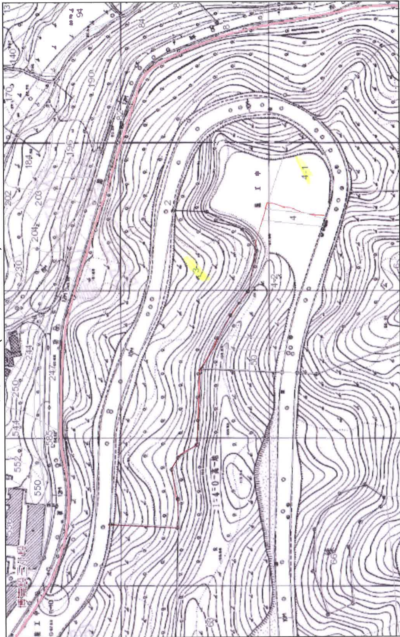
歷史圖資(69年版地形圖)