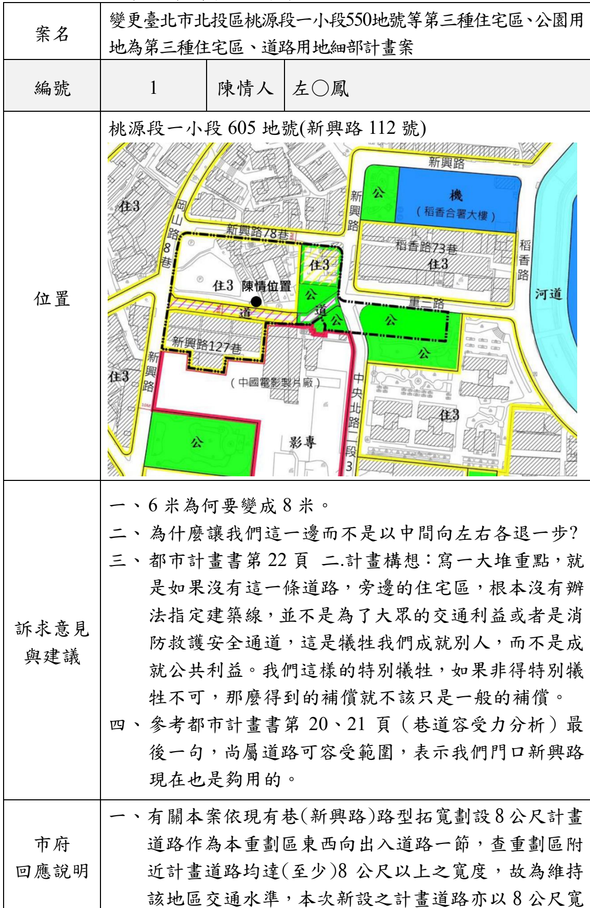
臺北市都市計畫委員會公民或團體意見綜理表