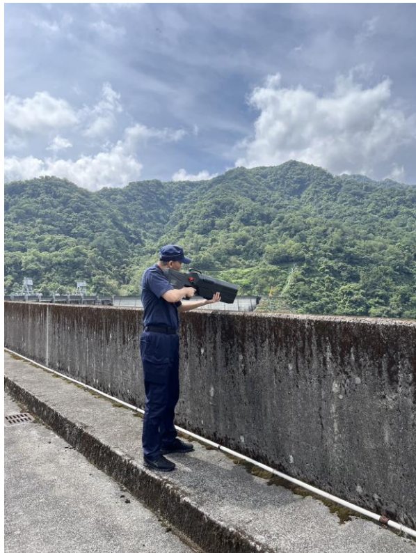
執行無人機反制作業