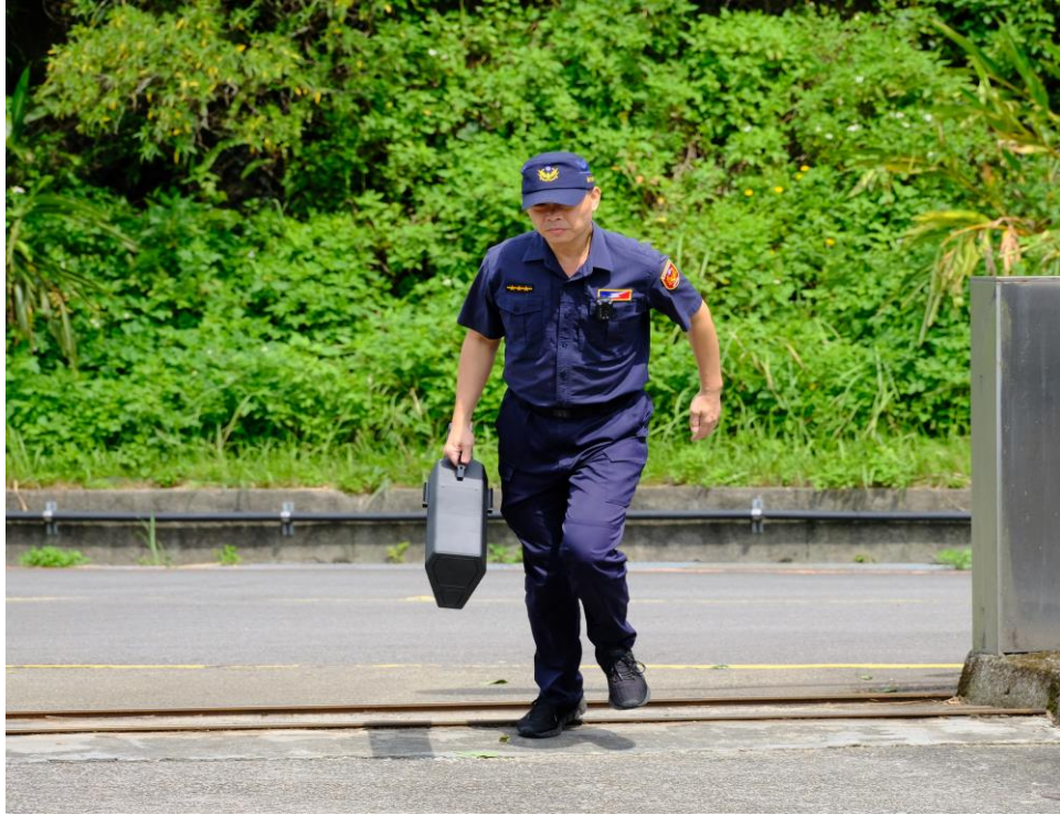
無人機攔截設備攜帶方便