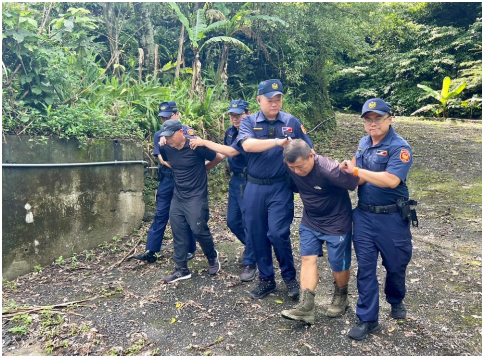
非法入侵庫區人員予以逮捕法辦