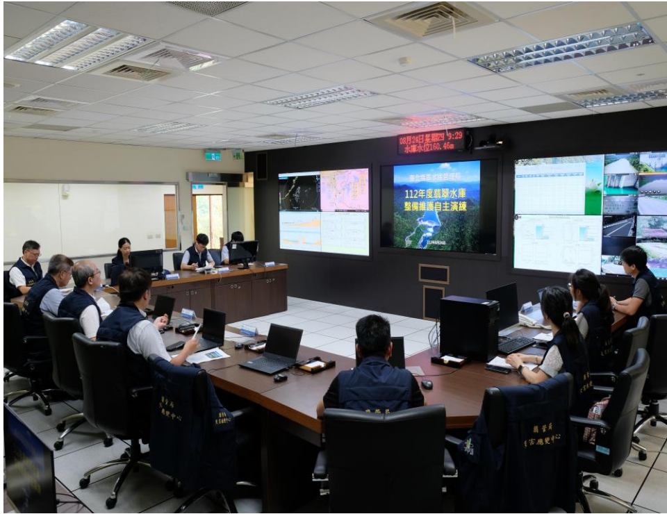
翡翠水庫應變中心進行整備維護演練