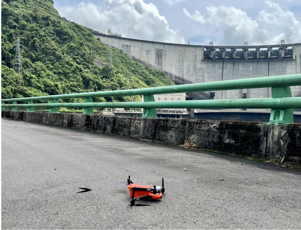
反制無人機飛行器闖入，予以擊落