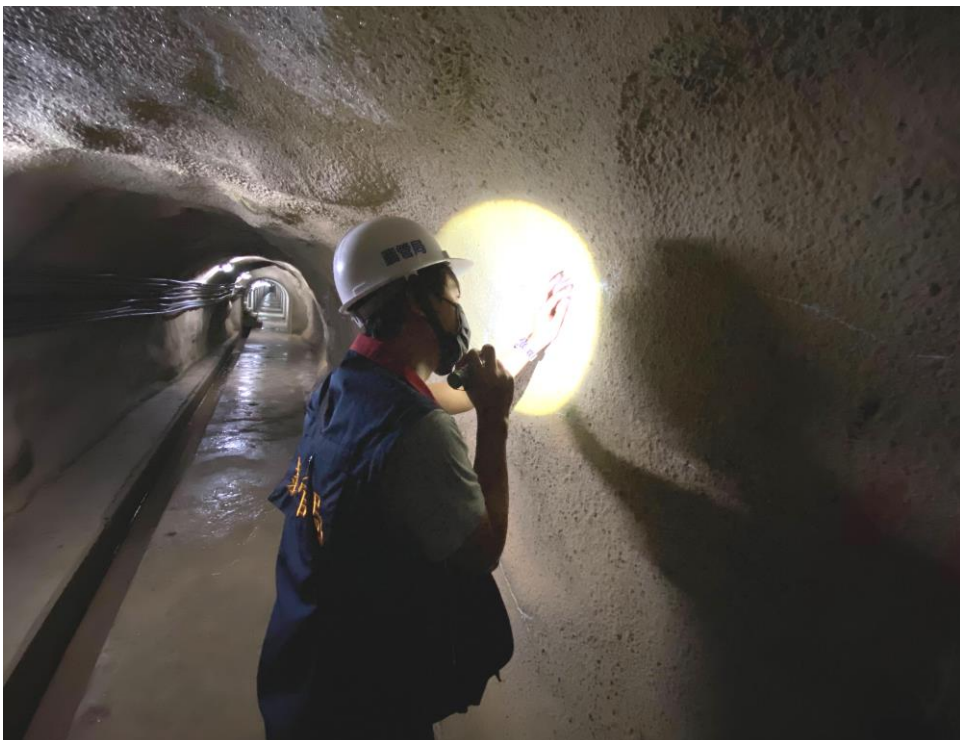
強震後，工程司即全面進行大壩安全檢查作業