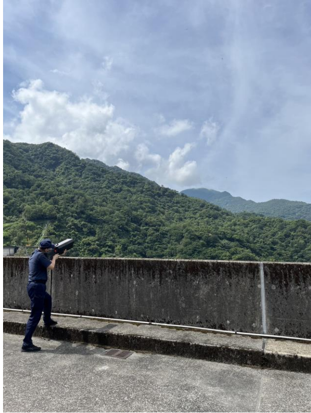
執行無人機反制作業