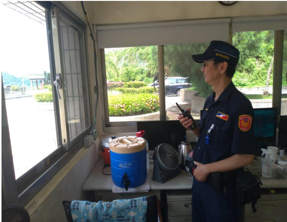
大頂崗哨發現異常狀況，立即通報