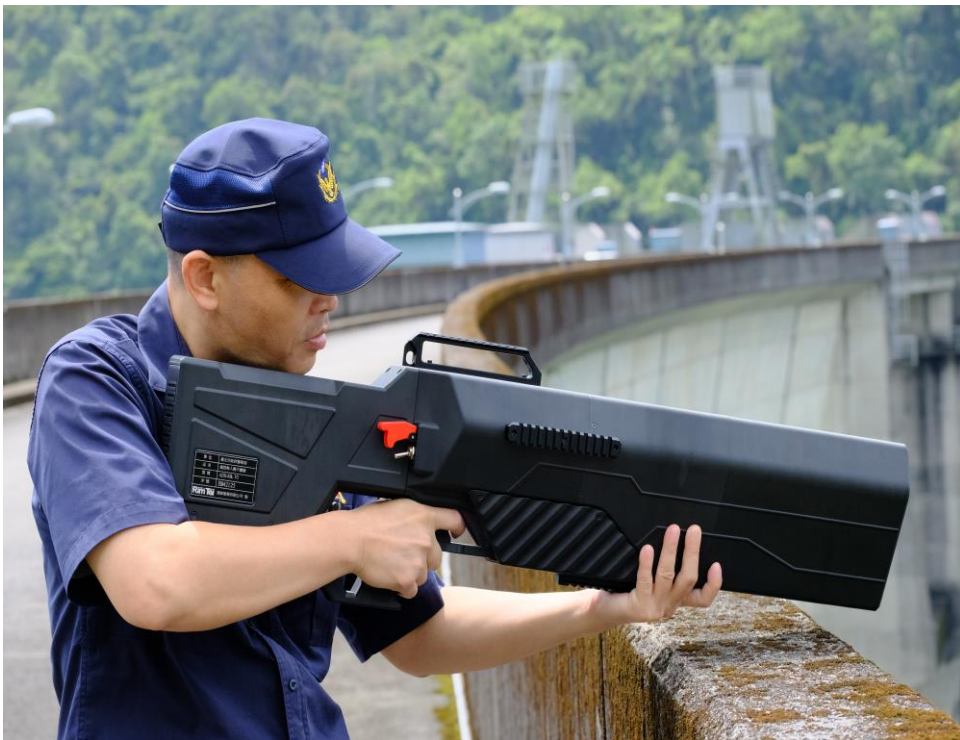
反制入侵無人機飛行器