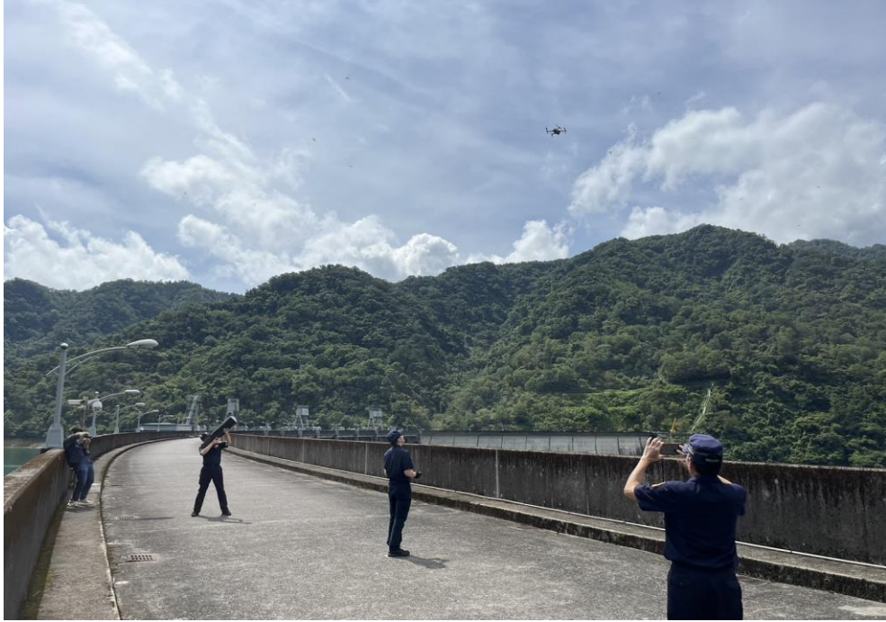
執行無人機反制作業