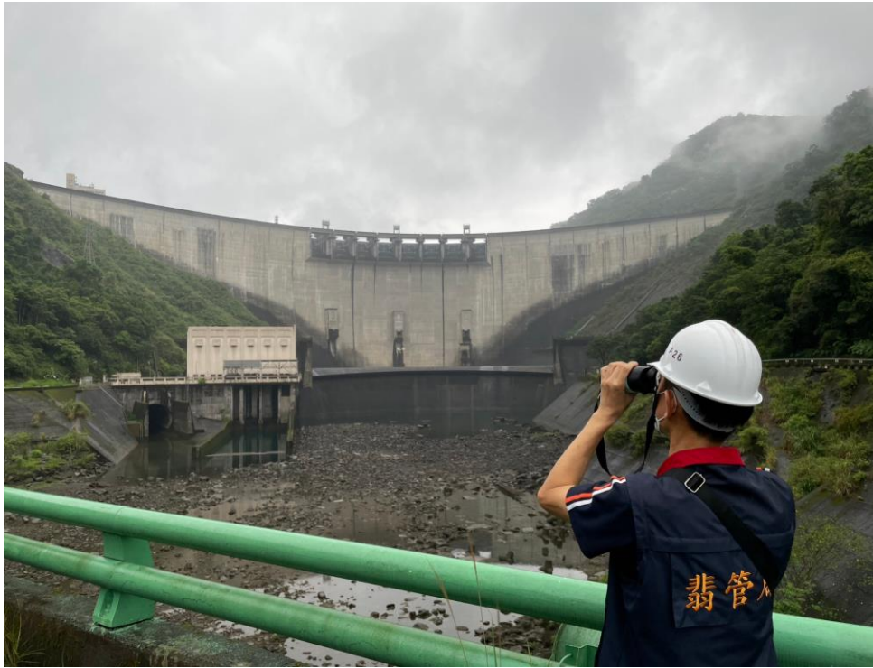
翡翠大壩現地巡查