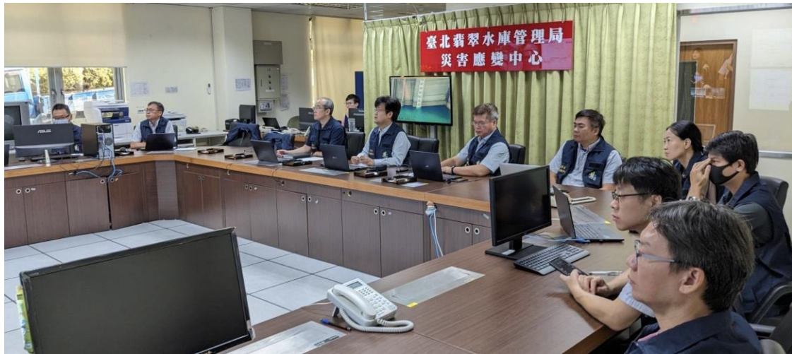
翡翠水庫管理局-海葵颱風防災應變會議