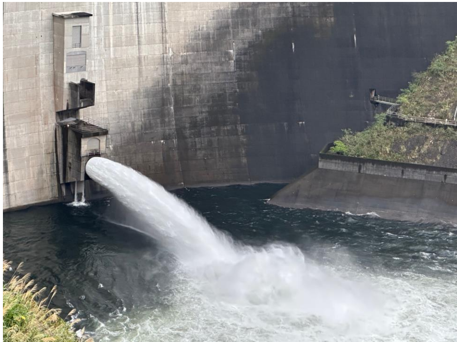
海葵颱風來臨前，翡翠水庫 9 月 1 日上午 11~21 時， 提前預降水位，控留蓄洪防災庫容