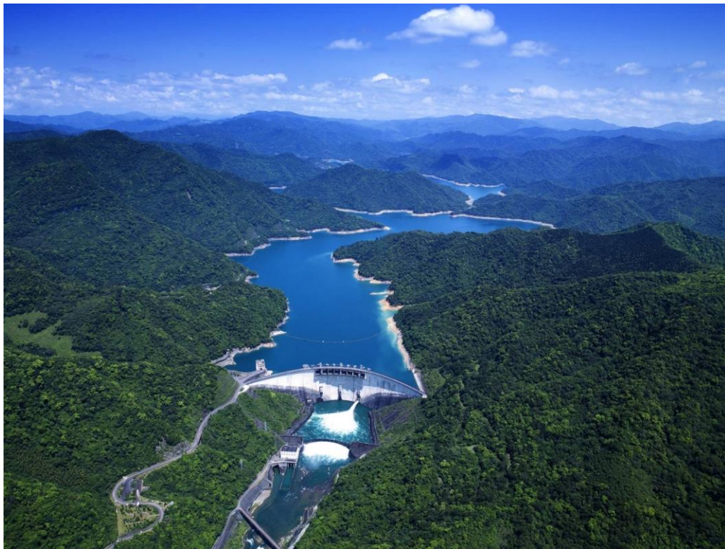
翡翠水庫控留庫容，可截留新店溪上游之北勢溪洪水 北勢溪流域面積廣達 303 平方公里(相當台北市面積 1.1 倍)