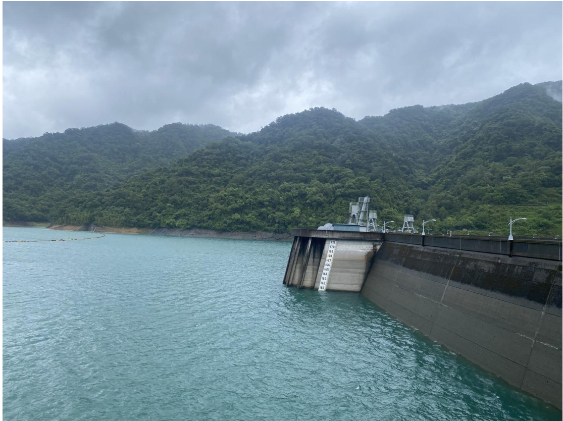
翡翠水庫因應海葵颱風，提前預降水位，有效蓄洪防災