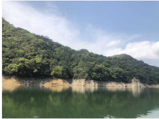
翡翠水庫水域邊坡無災損情形