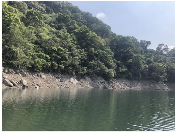
翡翠水庫水域邊坡無災損情形