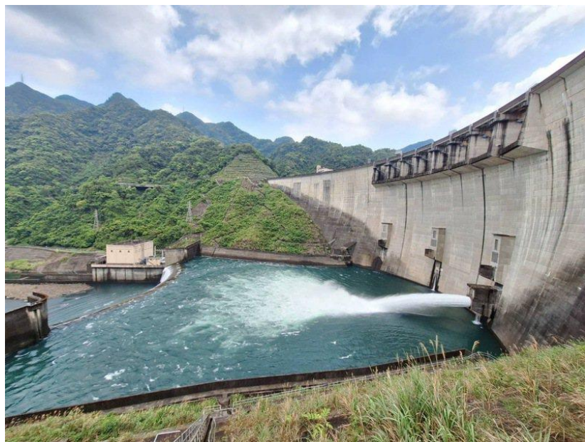
翡翠水庫民生供水，維持正常運作