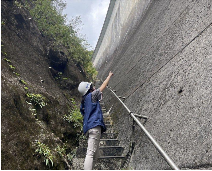
翡翠大壩外部結構巡檢無異常