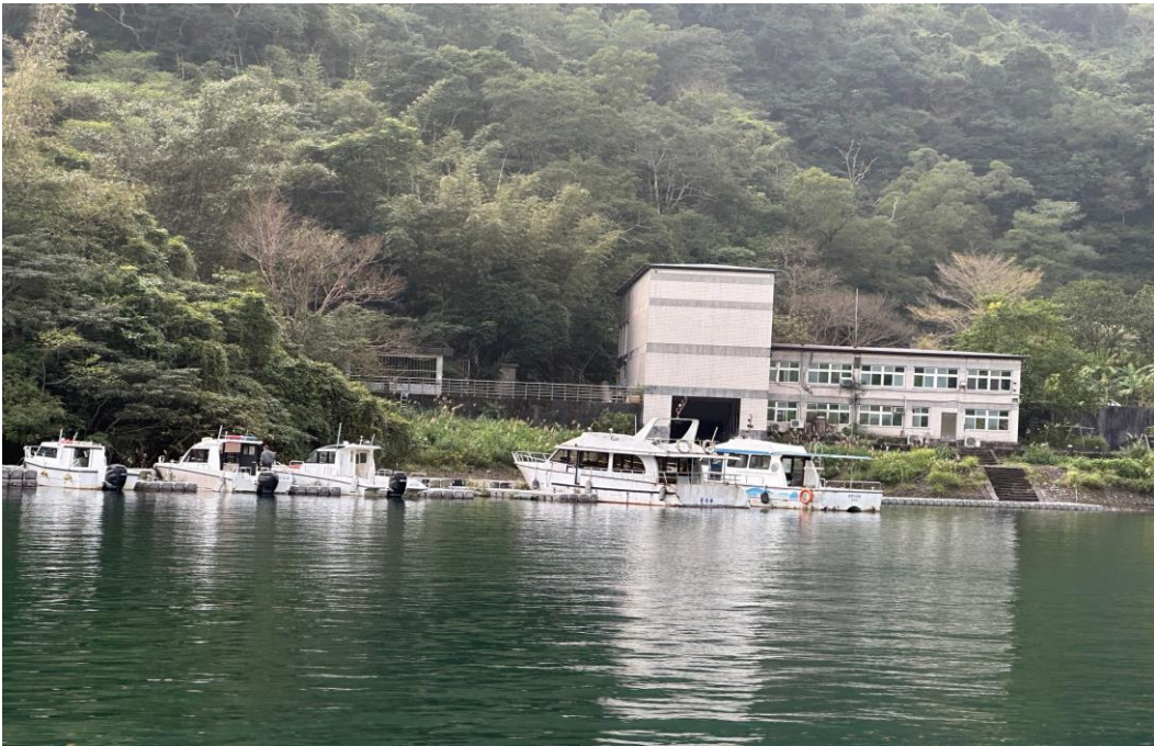
翡翠水庫 4 月 4、5 日開闢二航道服務在地鄉親清明祭祖