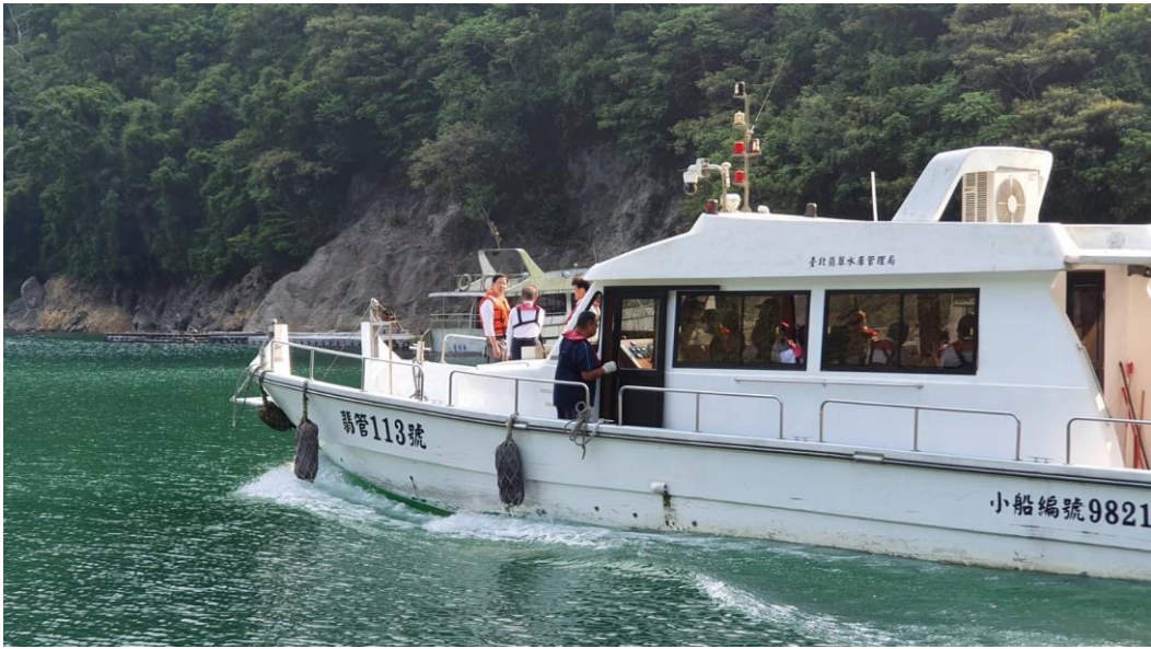
翡翠水庫 4 月 4、5 日開闢二航道服務在地鄉親清明祭祖