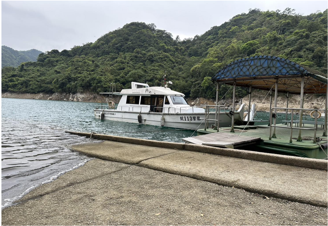
翡翠水庫清明掃墓船艇接駁服務(新店區-翡翠水庫碼頭)