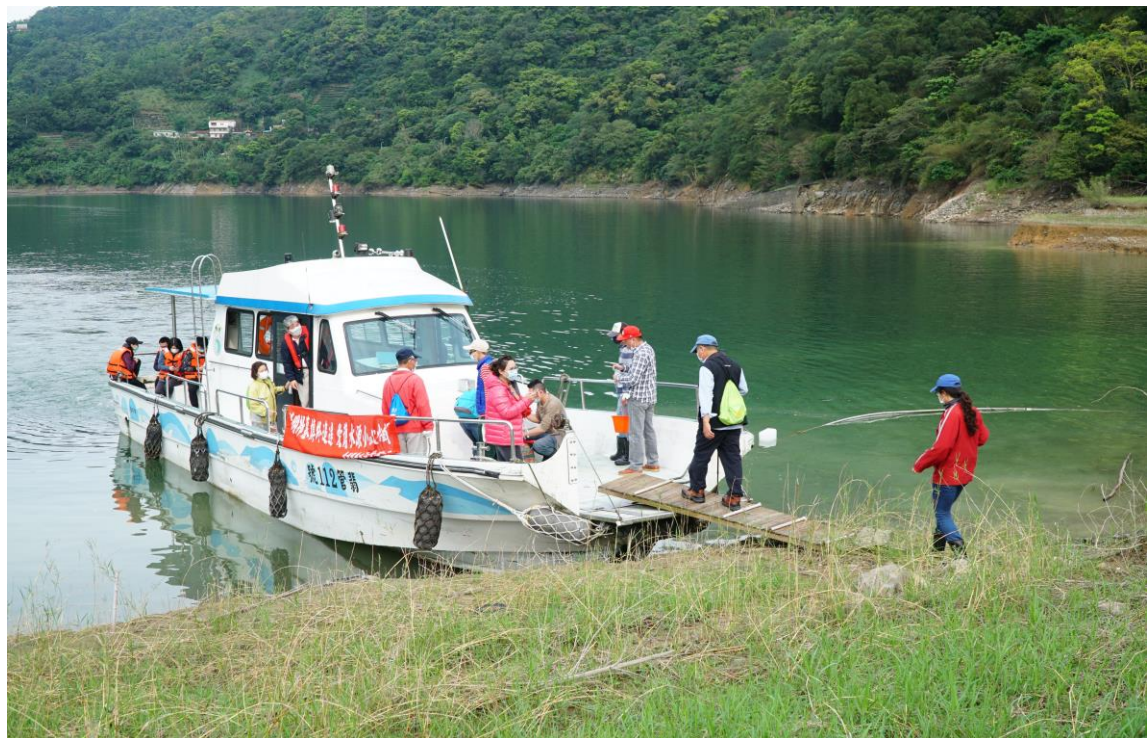
翡翠水庫清明掃墓船艇接駁服務(石碇區-永安碼頭)