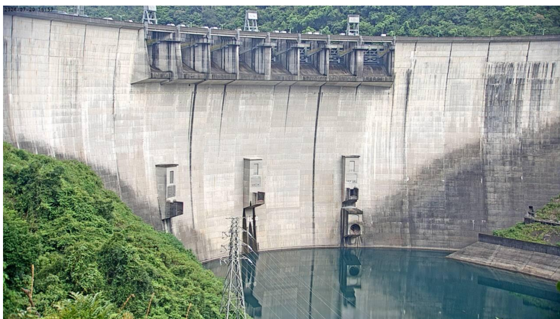
翡翠水庫大壩現況