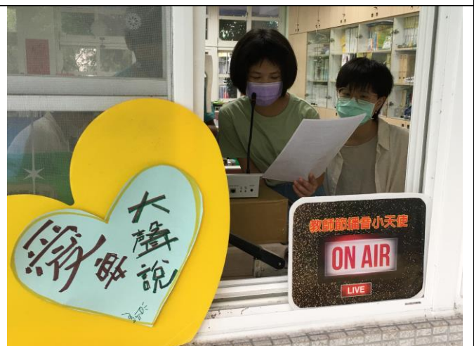
06 謝謝老師，愛我!祝福老師~教師節快樂!!