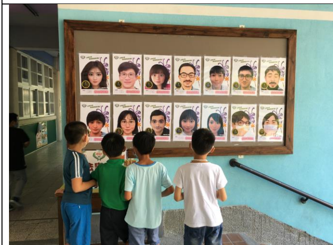
05 特別行動-<魔法變變變>，猜猜我是誰?