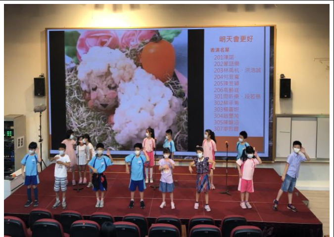
04 教師節慶祝大會，學生為老師歡唱表演。