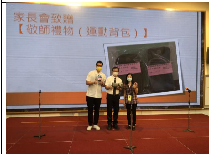
03 家長會長代表致贈敬師禮物，感謝老師辛勞!