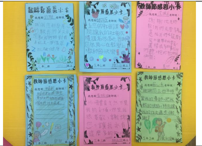
02 感恩敬師小卡，表達謝師心意。