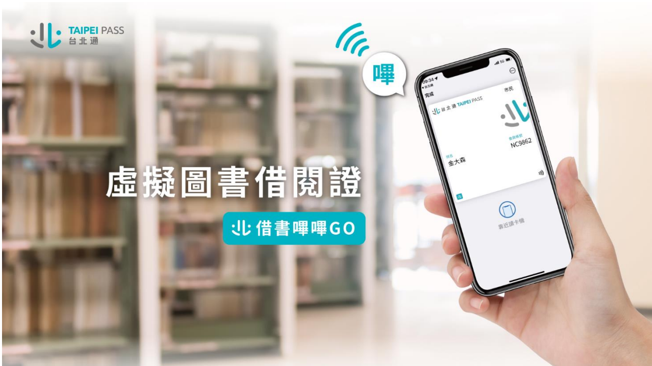
圖1：台北通虛擬卡示意圖。