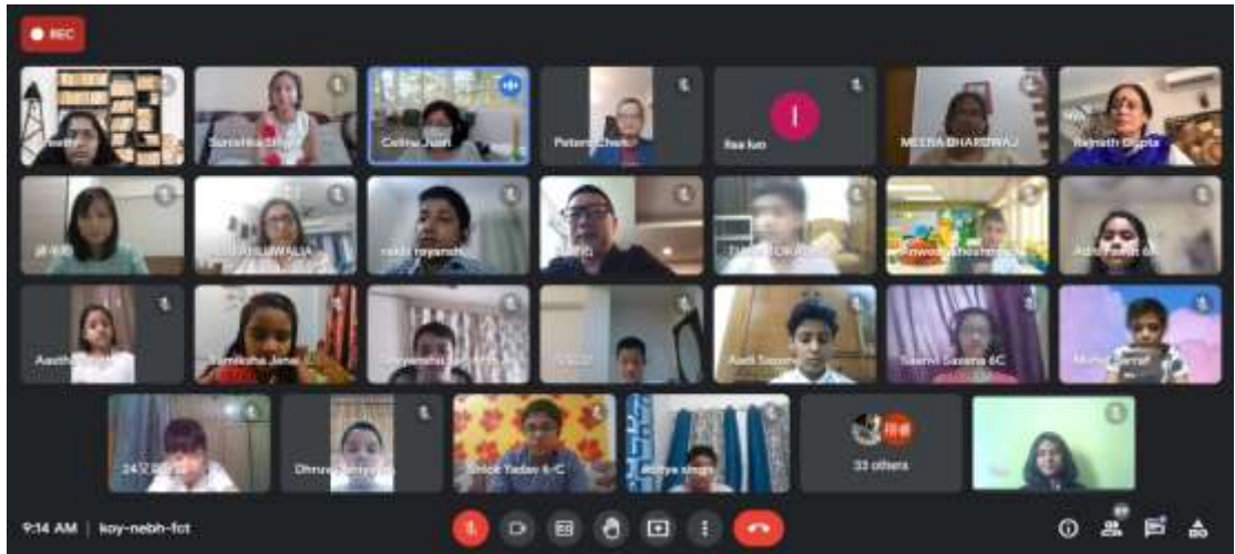
泰北高中與印度 ISA Ramjas School 線上課程分享會