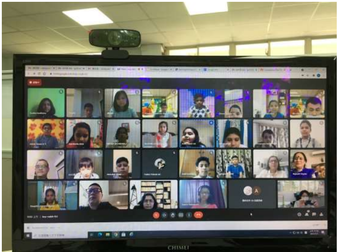
泰北高中與印度 ISA Ramjas School 線上課程分享會