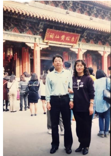
潛昭與另一半深諳夫妻相處之道，三十多年來伉儷情深令人艷羨。

以他說不論夫妻倆的感情有多好、多親密，夫妻之間的相處還是應該要「謹言慎行」，不要說錯話，不講不該講的話，也不要當『竊聽器』--不聽不該聽的話；除此之外，他更進一步建議，夫妻說話最好是面對面看著對方，因為看著對方時才可以看到對方的表情，也讓對方看到自己的表情，這樣一來，既可以輕聲細語溝通，也不會產生不必要的誤會。幾句話輕描淡寫的帶過，細細品味之後才發現，原來真要落實在生活實踐之中，其實也沒那麼容易。