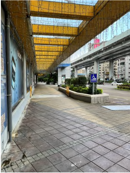
避難層坡道及扶手