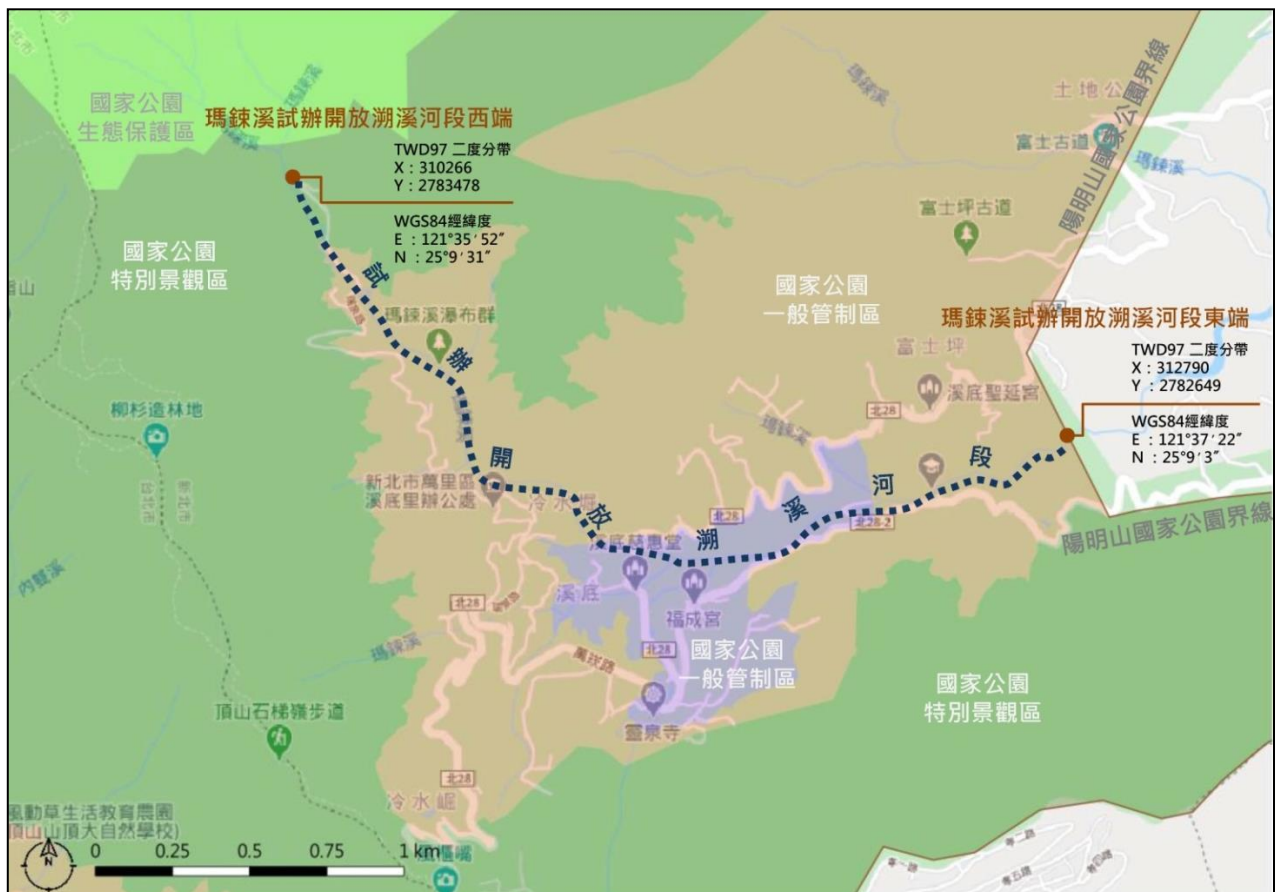
▲瑪鍊溪開放河段圖示

(2) 開放時段:與頭前溪採每年輪流開放，開放期間為當年度之 7 月至 10 月，並得視情形檢討調整公告。