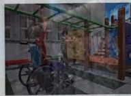
平梯 Monkey Bars

手扶扶手，腳踩圓木，依序向前進。 Move forward by stepping on the wooden bridge step by step.