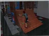
弧形攀岩板 Boulder / Climbing Wall

手抓攀岩塊，腳踩攀岩塊，依序向上爬。 Use the climbing pecks to climb up.