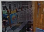
繩鑽籠 Rope Tunnel

雙手抓橫桿，一手抓前方橫桿，另一手抓下一橫桿，依序向前進。 Hold on to the first rung with your knees bent, and swing from one end to the other.