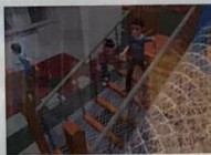
圓木吊橋 Wooden Bridge

身體向前趨，四肢著地，慢慢匍匐前進。 Crawl through the pipe on hands and knees.