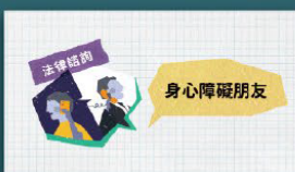
身心障礙者法律扶助專案