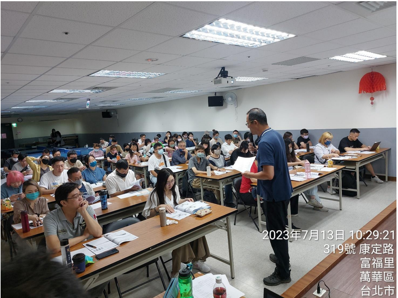
2023年7月13日 10:29:21 319號 康定路 富福里 萬華區 台北市