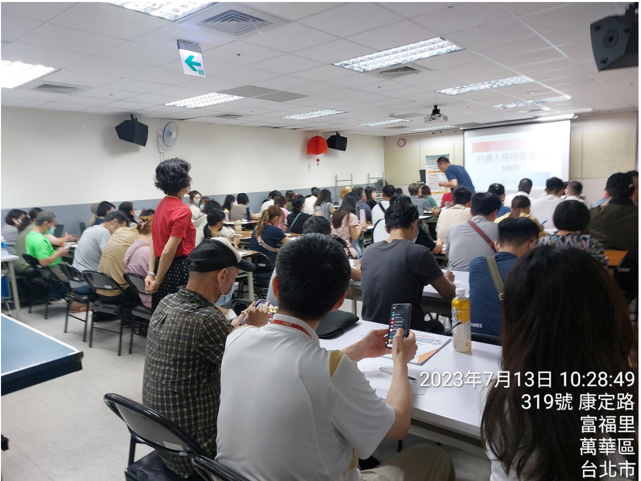
2023年7月13日 10:28:49 319號 康定路 富福里 萬華區 台北市