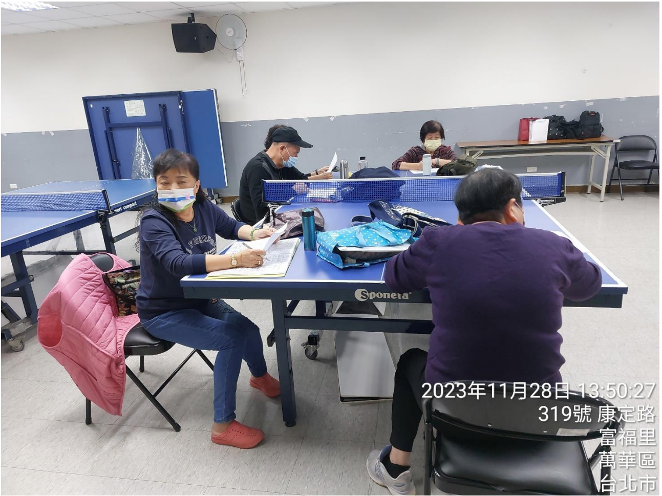
2023年11月28日-13:50:27 319號 康定路 富福里 萬華區 台北市