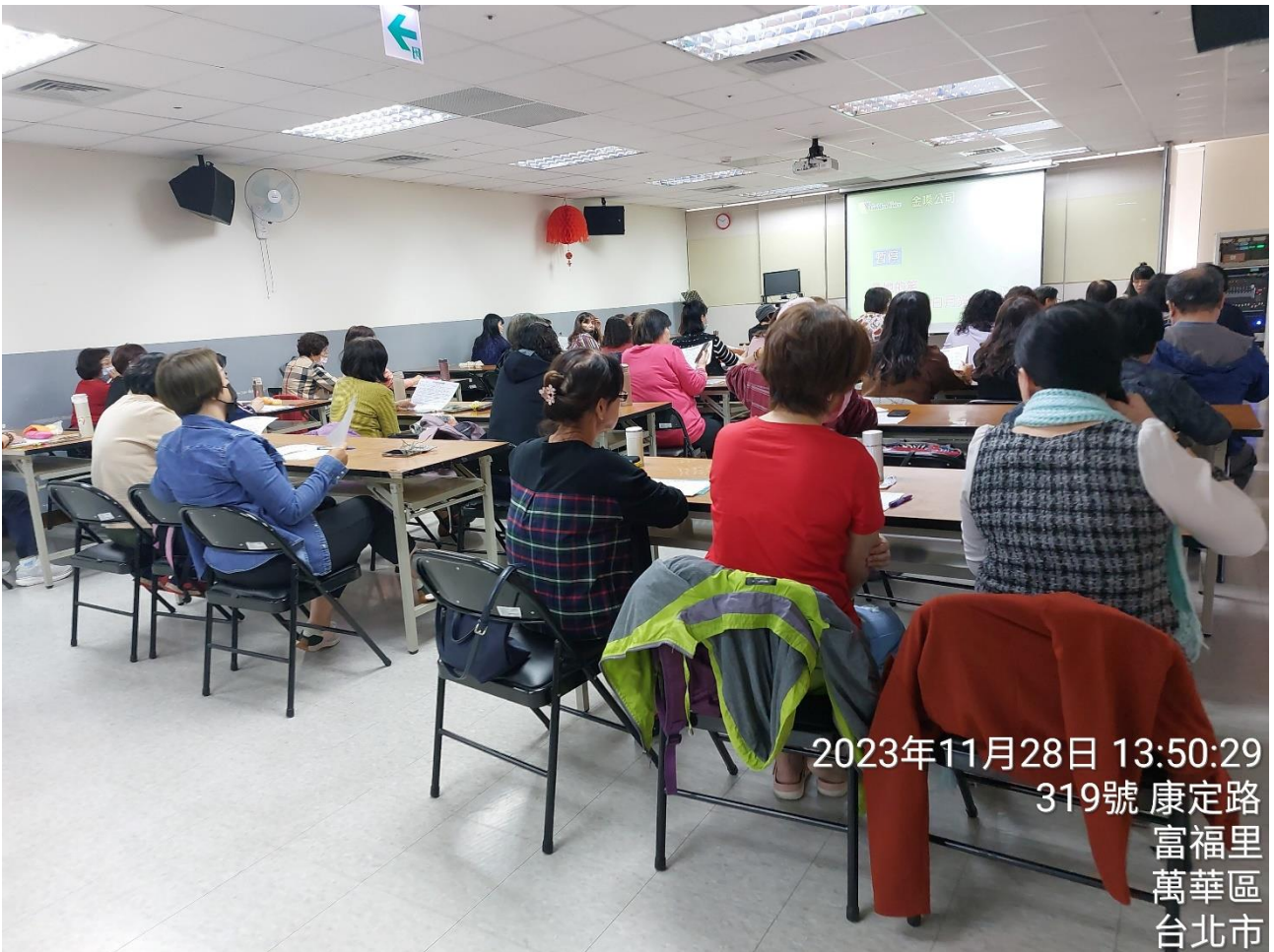
2023年11月28日 13:50:29 319號 康定路 富福里 萬華區 台北市