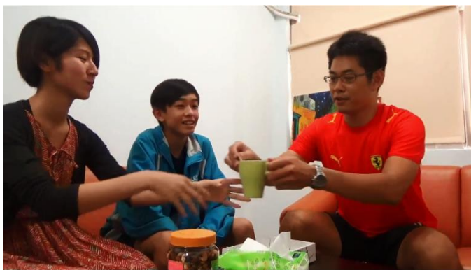
國中學生微電影作品：熱牛奶的溫度