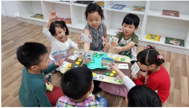
幼兒園學生透過桌遊學習情緒表達與調適