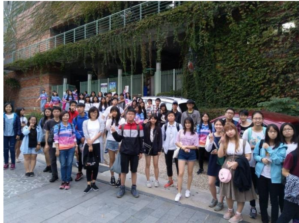
高中職「青春巴士觀影去！」活動剪影