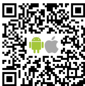
臺大醫院行動服務

臺大醫院係依據衛生福利部疾病管制署「COVID 19(武漢肺炎防疫新生活運動：實聯制措施指引）」、「醫療機構因應COVID 19(武漢肺炎探病管理作業原則)」和「個人資料保護法」，基於公共衛生或傳染病防治之特定目的，為防堵疫情而有必要時，得提供衛生主管機關依傳染病防治法等規定進行疫情調查及聯繫使用，蒐集必要之個人資料，含姓名、身份證字號、電話號碼、訪視對象和旅遊史必要資料。您的個人資料得依個人資料保護法規定行使相關權利。本院將依個人資料保護法就以上個人資料進行妥善保護，並於蒐集日起28日後刪除或銷毀。您同意並瞭解本院蒐集、處理或利用個人資料之目的及用途。