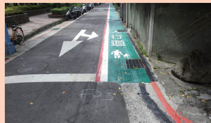
金山南路2段185巷(劃設標線型人行道後)