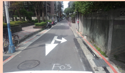
金山南路2段185巷(劃設標線型人行道前)