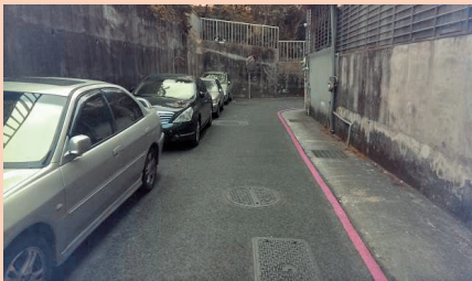
北安路759巷狹小巷道劃設前