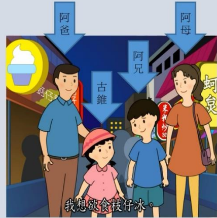
圖六：臺北市公播課程影片—國小生活課