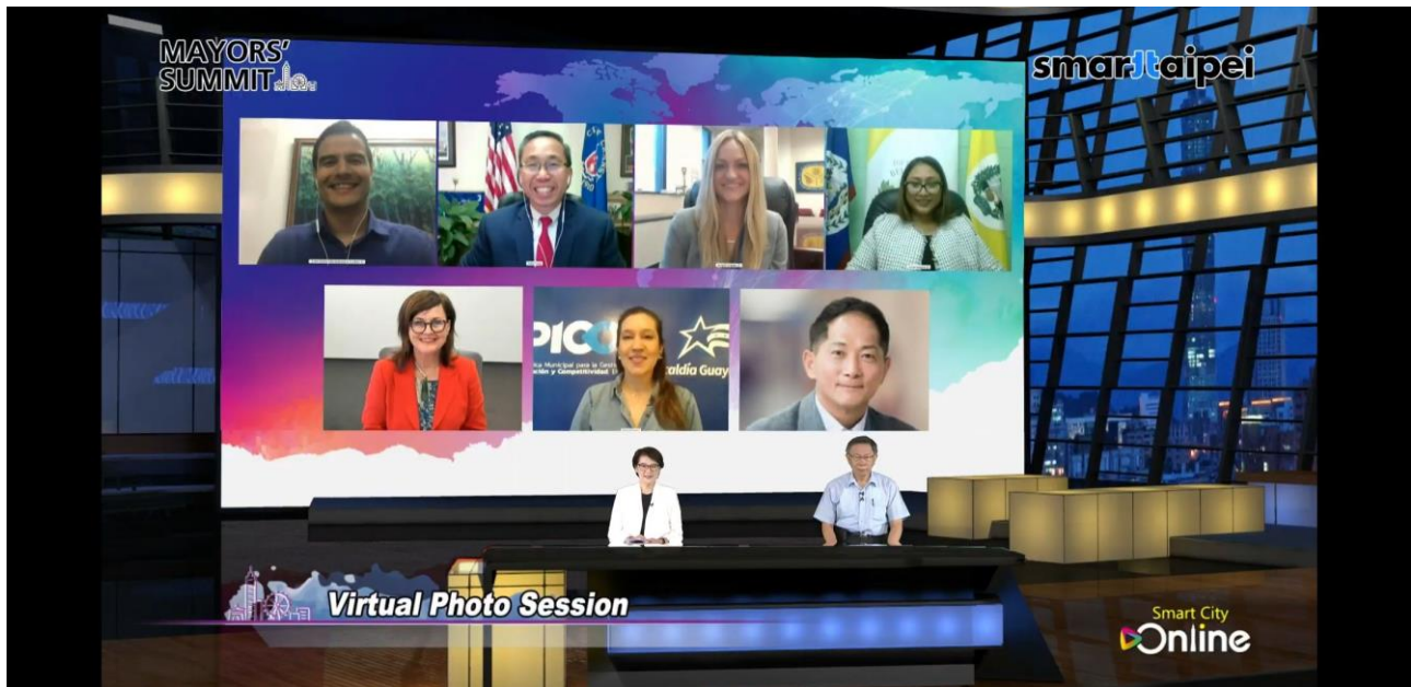
圖6：2020智慧城市首長高峰會第二場（台北市市長柯文哲、副市長黃珊珊與哥倫比亞麥德林市資訊科技局副局長、美國克蘭斯頓市長、美國斯克蘭頓市長、貝里斯貝爾墨潘市副市長、紐西蘭威靈頓議員、厄瓜多惠夜基市創新與競爭力管理局長、南韓高陽市市長視訊合影。）