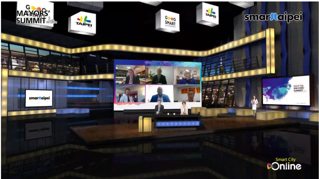
圖4：2020智慧城市首長高峰會全景照