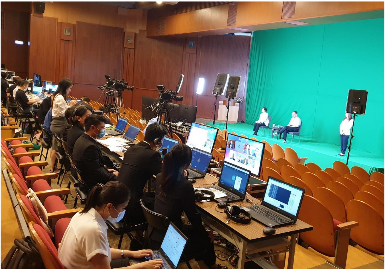
圖1：2020智慧城市首長高峰會虛擬攝影棚現場

https://www.facebook.com/doit.taipei230/