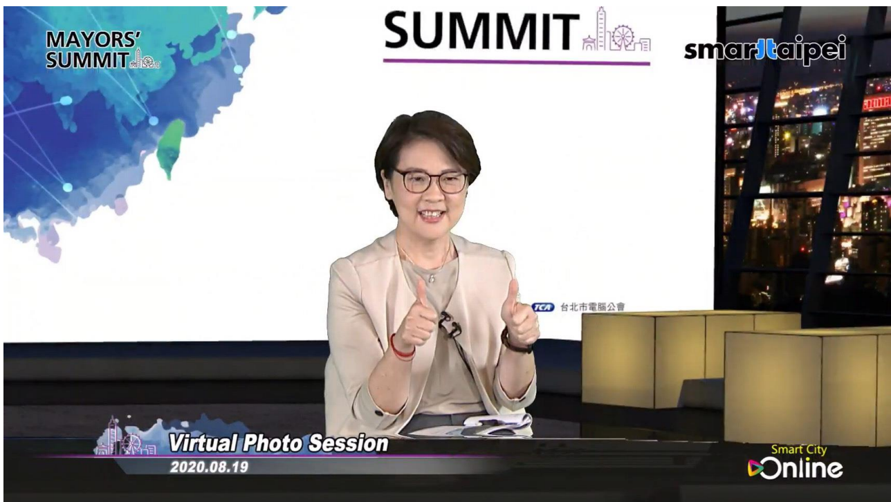
圖3：2020智慧城市首長高峰會(台北市副市長黃珊珊)