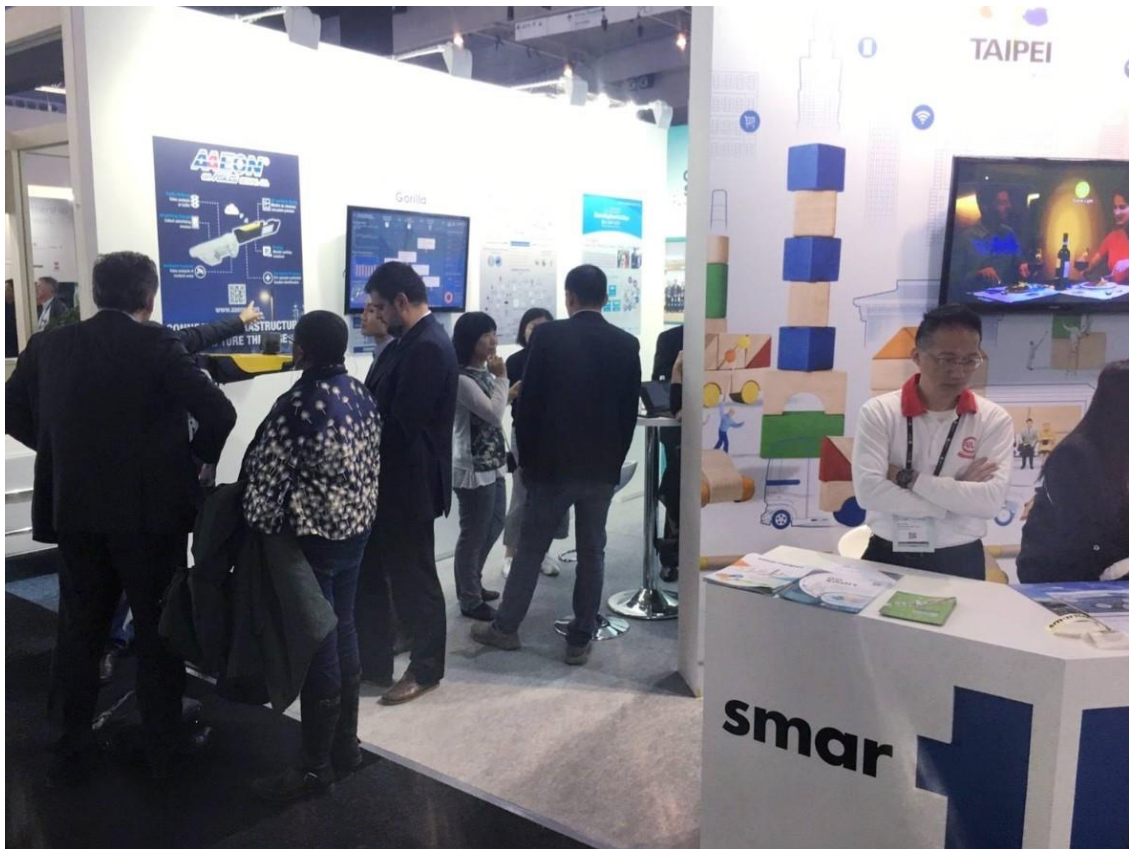
各國際單位參觀合作業者產品