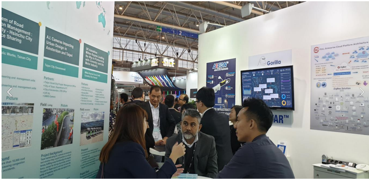
台北館現場參觀盛況