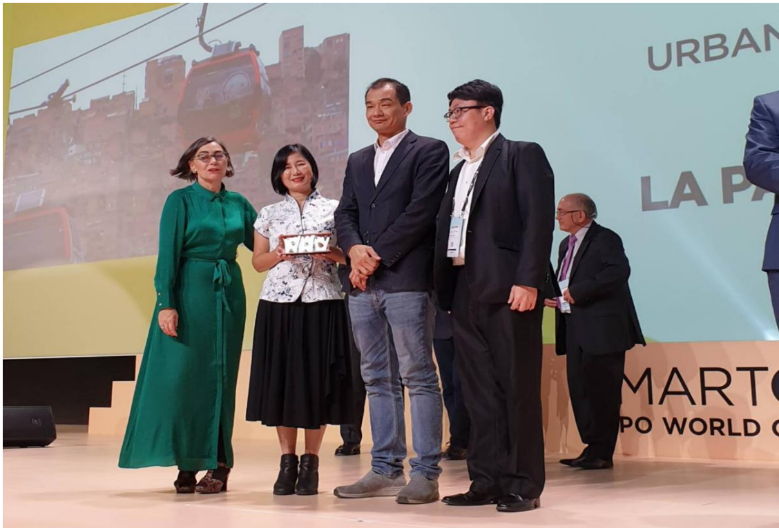
台北市政府資訊局主秘上台領獎