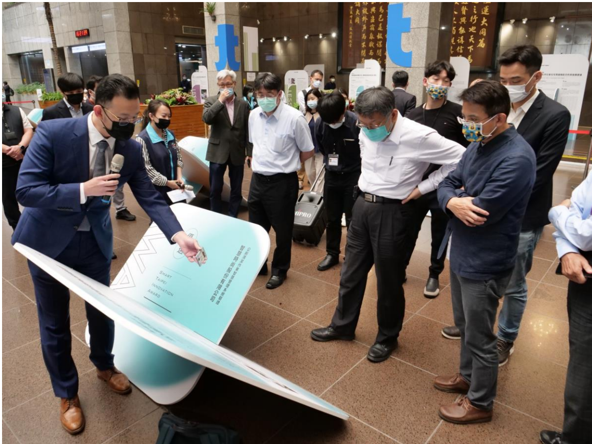
圖7：市長與秘書長參觀展覽現場，逐一聽取每個獲獎專案的介紹