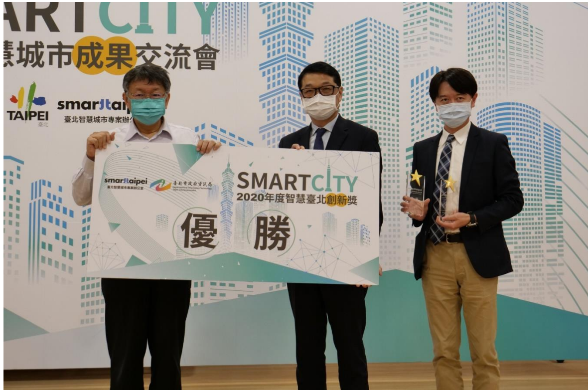
圖3：市長頒發優勝獎項予獲獎廠商