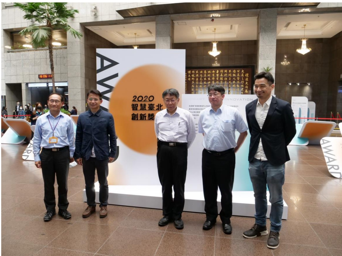
圖8：市府長官(左至右:交通局局長陳學台、資訊局局長呂新科、臺北市長柯文哲、秘書長陳志銘、臺北智慧城市辦公室主任李鎮宇)在展覽現場進行合照