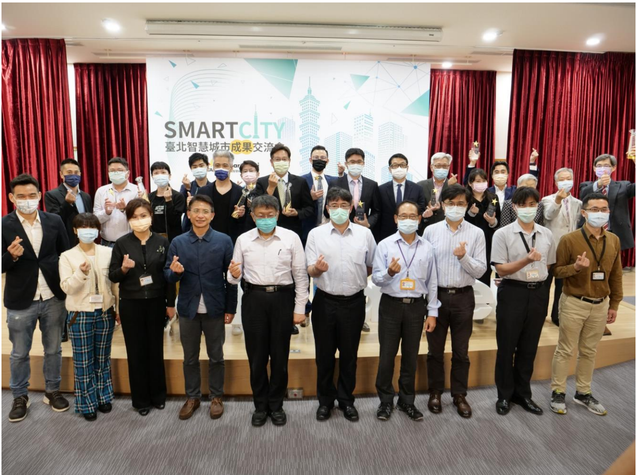
圖4：臺北智慧城市成果交流會圓滿結束，會後與會人員進行大合照