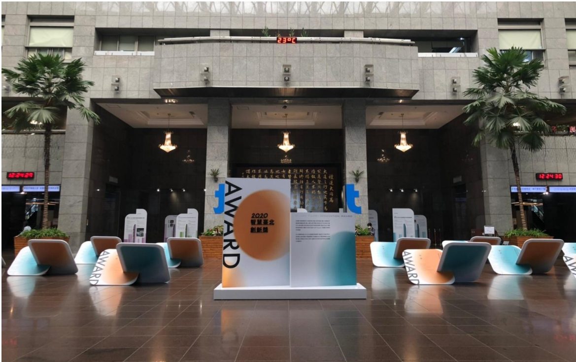
圖5：「2020年度智慧臺北創新獎成果展」於市府一樓中庭展出