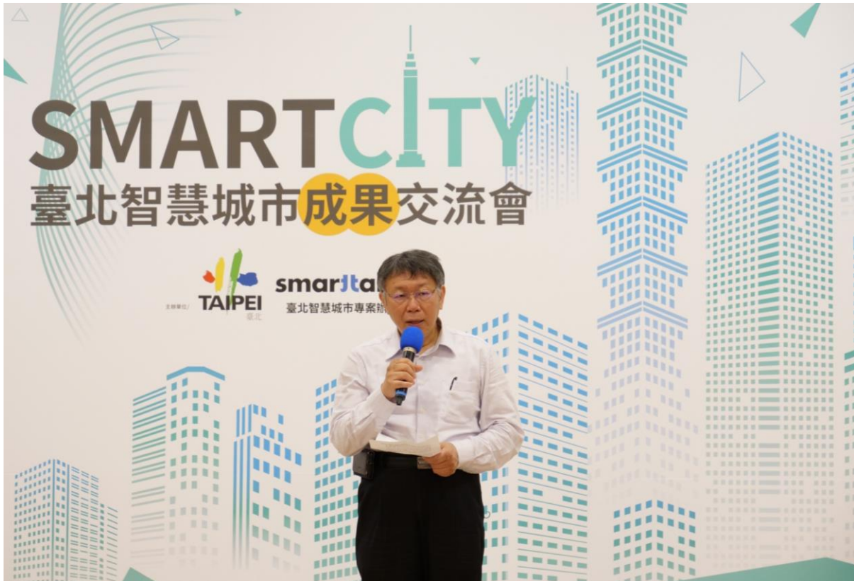
圖1：市長柯文哲於臺北智慧城市成果交流會致詞