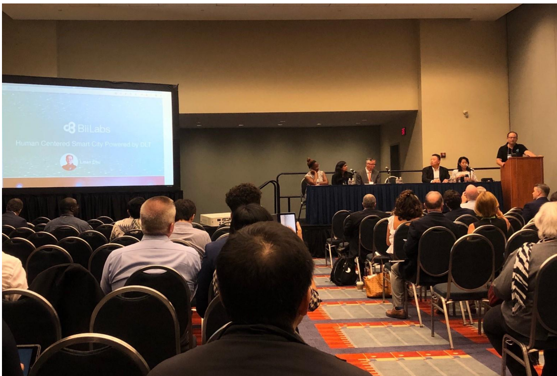
新創業者 BiiLabs CEO 朱宜振於 Cybersecurity and Privacy Super Cluster 進行演說