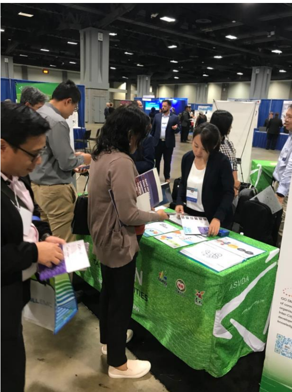
TPMO 於 GCTC 展覽攤位介紹 Smart Taipei，吸引交流