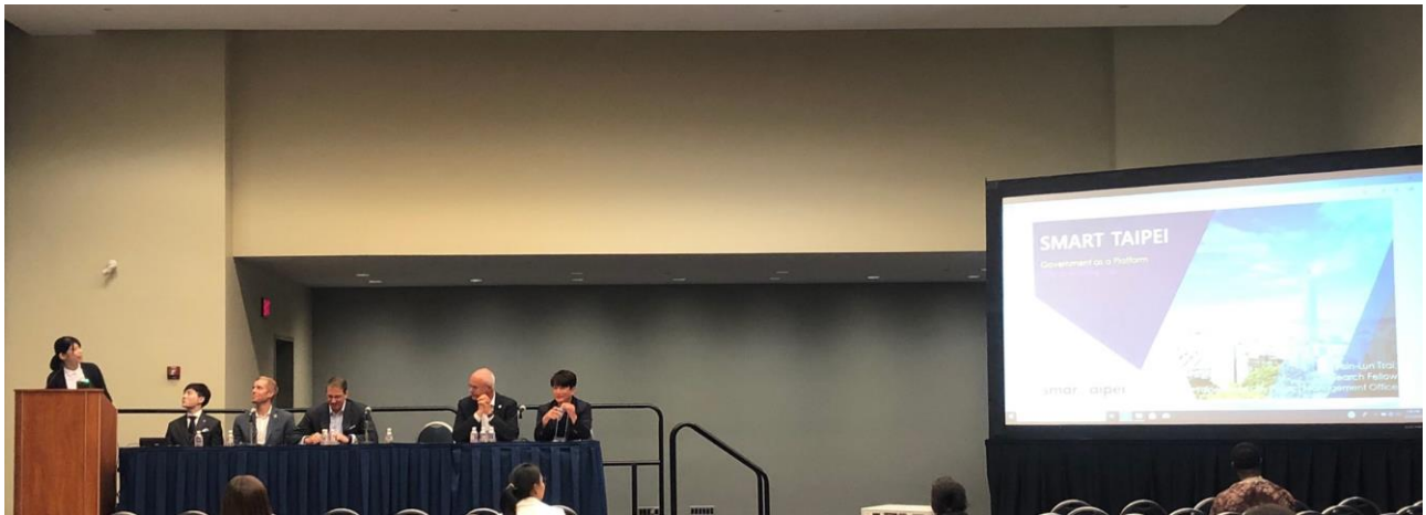
TPMO 於 Knowledge/Technology Platform 分論壇介紹台北發展智慧城市經驗