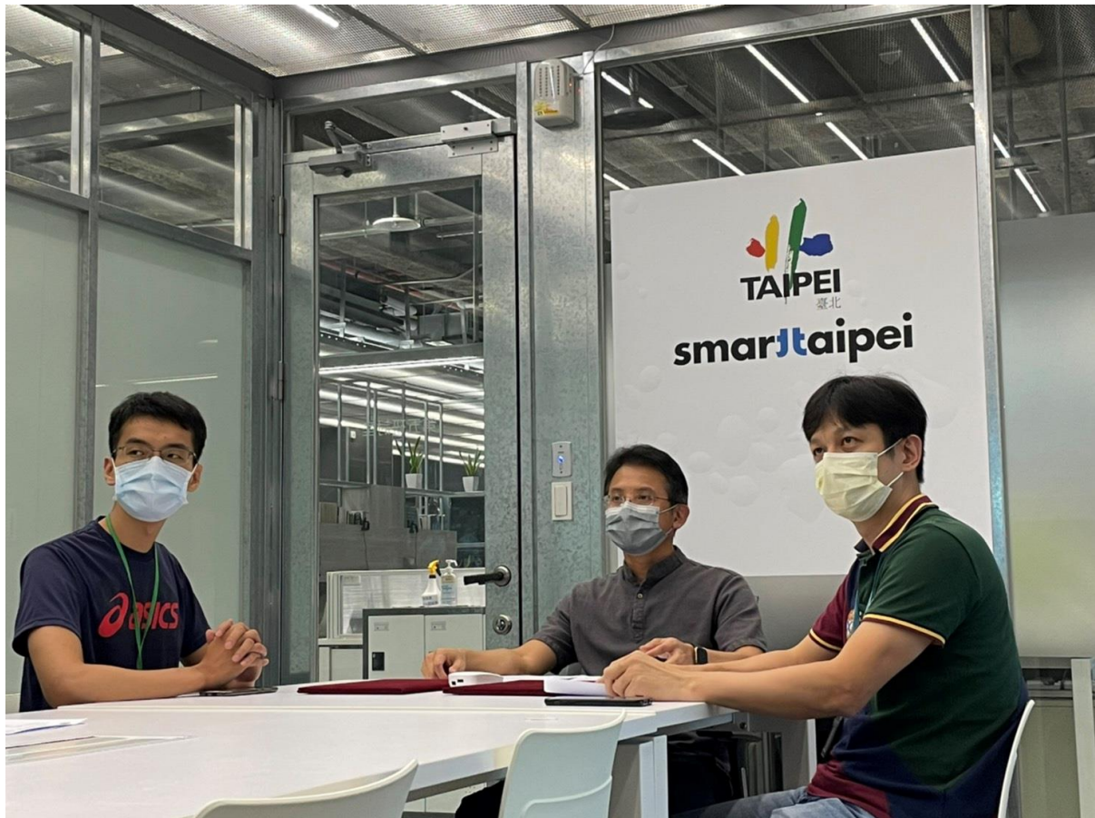
圖片2：資通安全合作備忘錄會議雙方致詞（臺北市府資訊局現場）