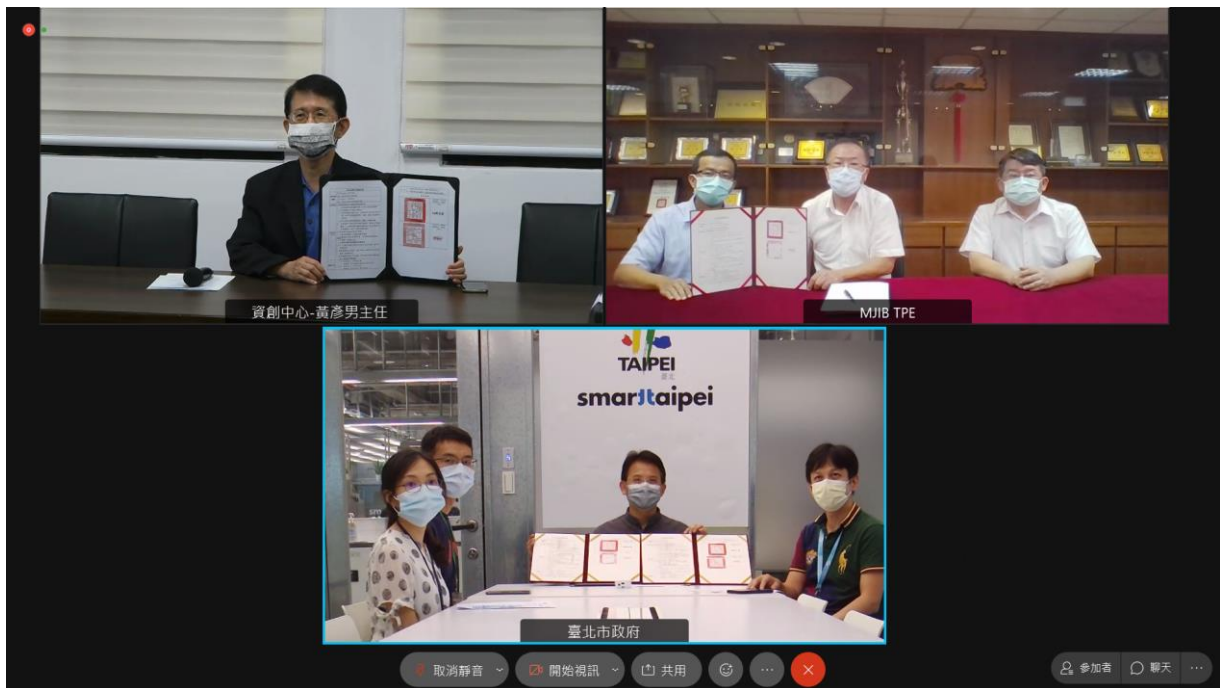
圖片1：臺北市府資訊局與中央研究院、法務部調查局臺北市調查處視訊簽署「資通安全合作備忘錄」