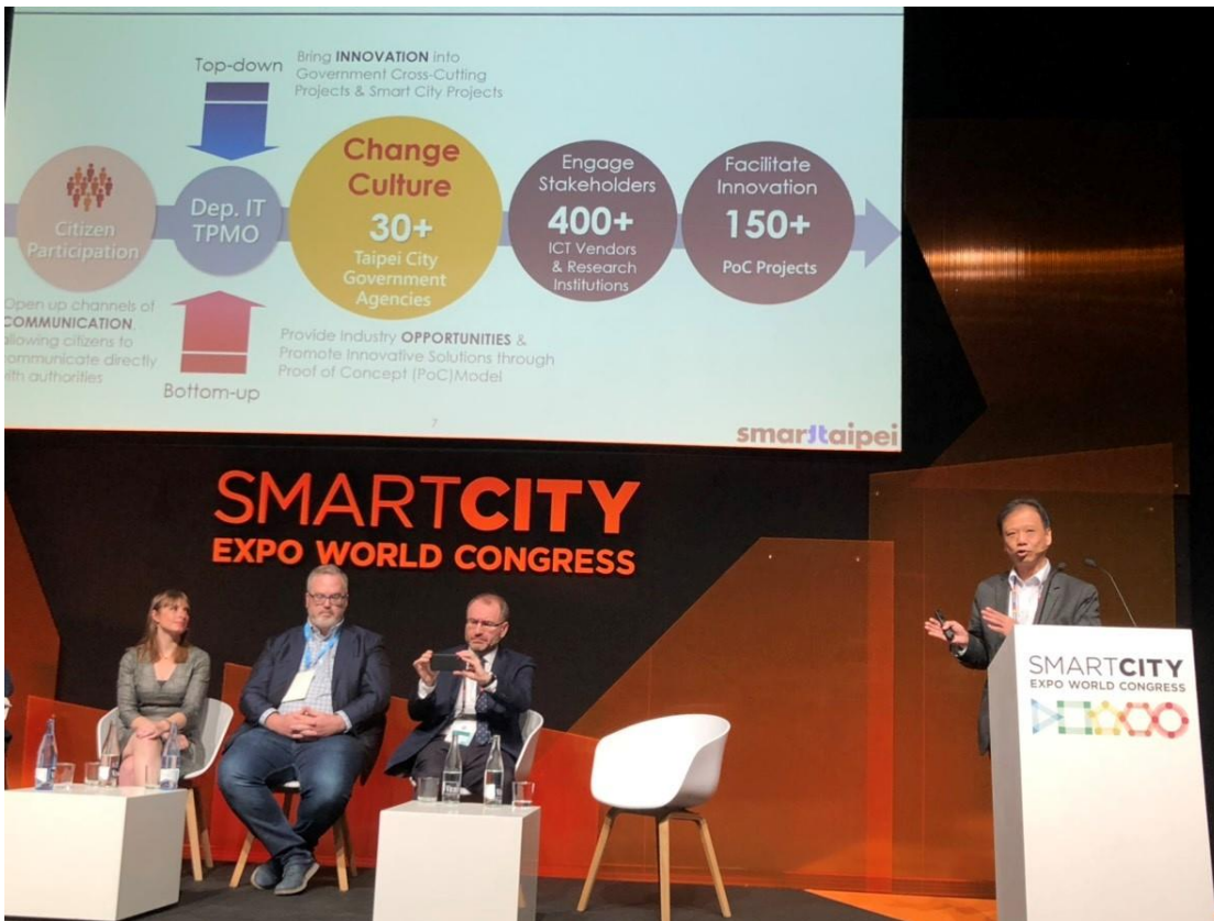
李維斌局長(圖右1)參與 Cities as Ecosystems: a Multi stakeholder's Approach 討論，分享臺北市推動智慧城市的機制及推動成果。