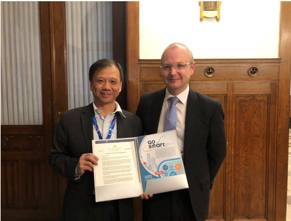
李維斌局長(圖左1)邀請捷克貿工部次長 Eduard Muřický 參與明年智慧城市展及加入 GO SMART。