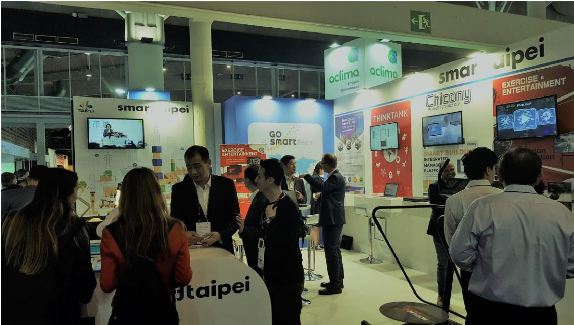
臺北市政府於西班牙巴塞隆納智慧城市展展出公私協力 POC 成果攤位，人潮絡繹不絕。