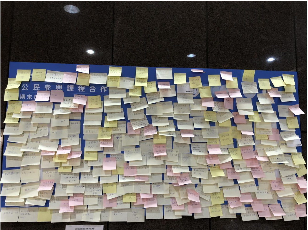
廣大市民與局處人員前往參觀展覽，並留言給學生和台北市鼓勵。