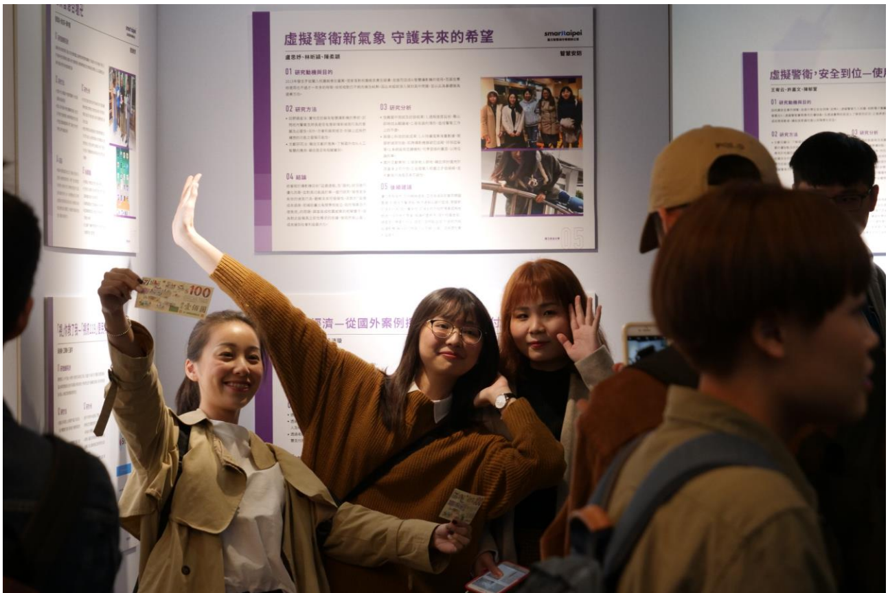
展覽的學生組別非常興奮的在自己的成果面前拍照留念。