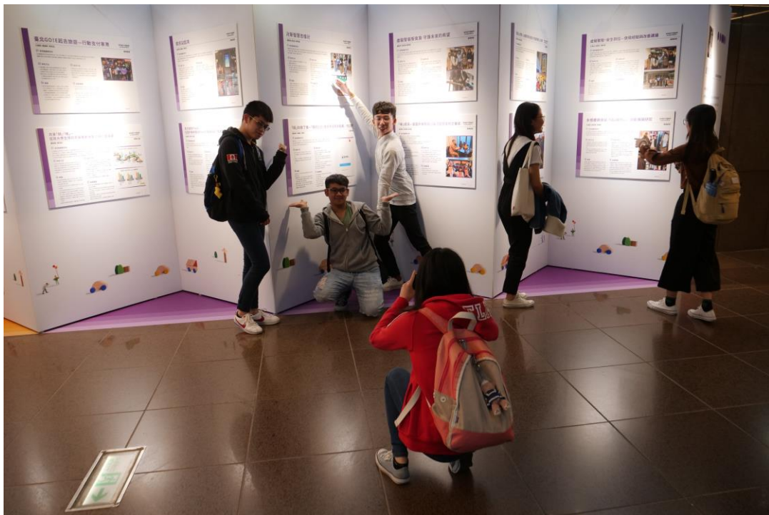
學生非常的熱情在展覽前面秀出自我，合影留念。