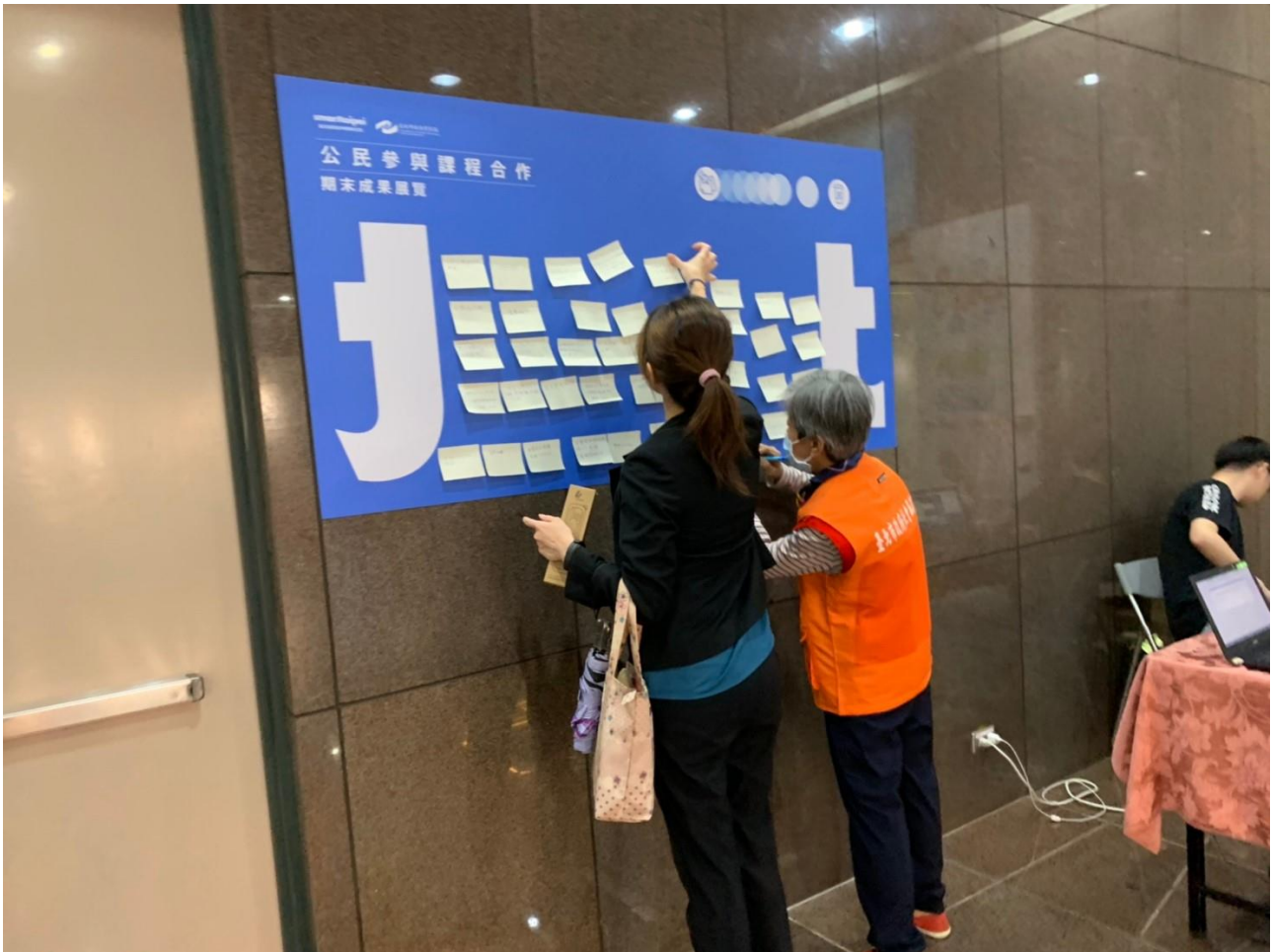
局處同仁與市民熱情的填寫問卷和留言牆，給予珍貴的意見回饋。