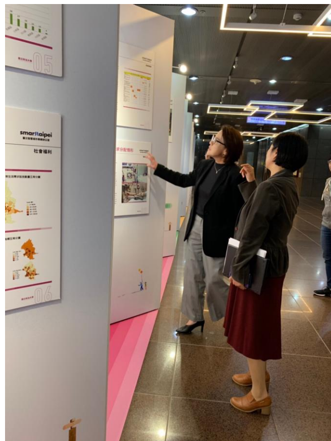
台北市副市長黃珊珊蒞臨現場參觀展覽，並大讚學生研究成果。