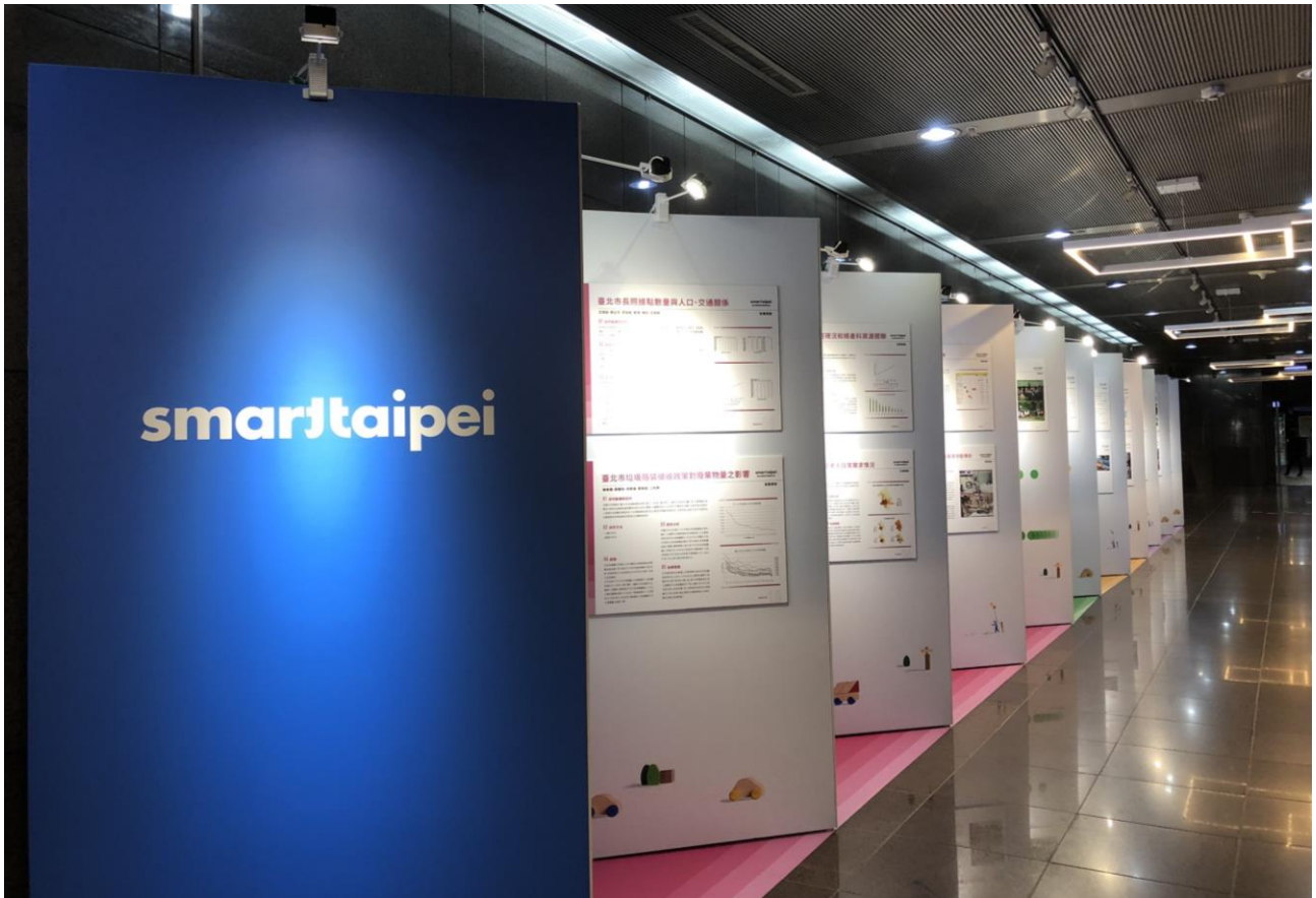
公民參與課程合作期末成果展展示區，呈現四門課程學生的研究成果。