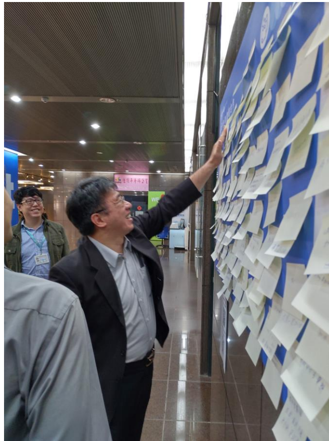
台北市副秘書長陳志銘填寫留言為學生們鼓勵打氣。