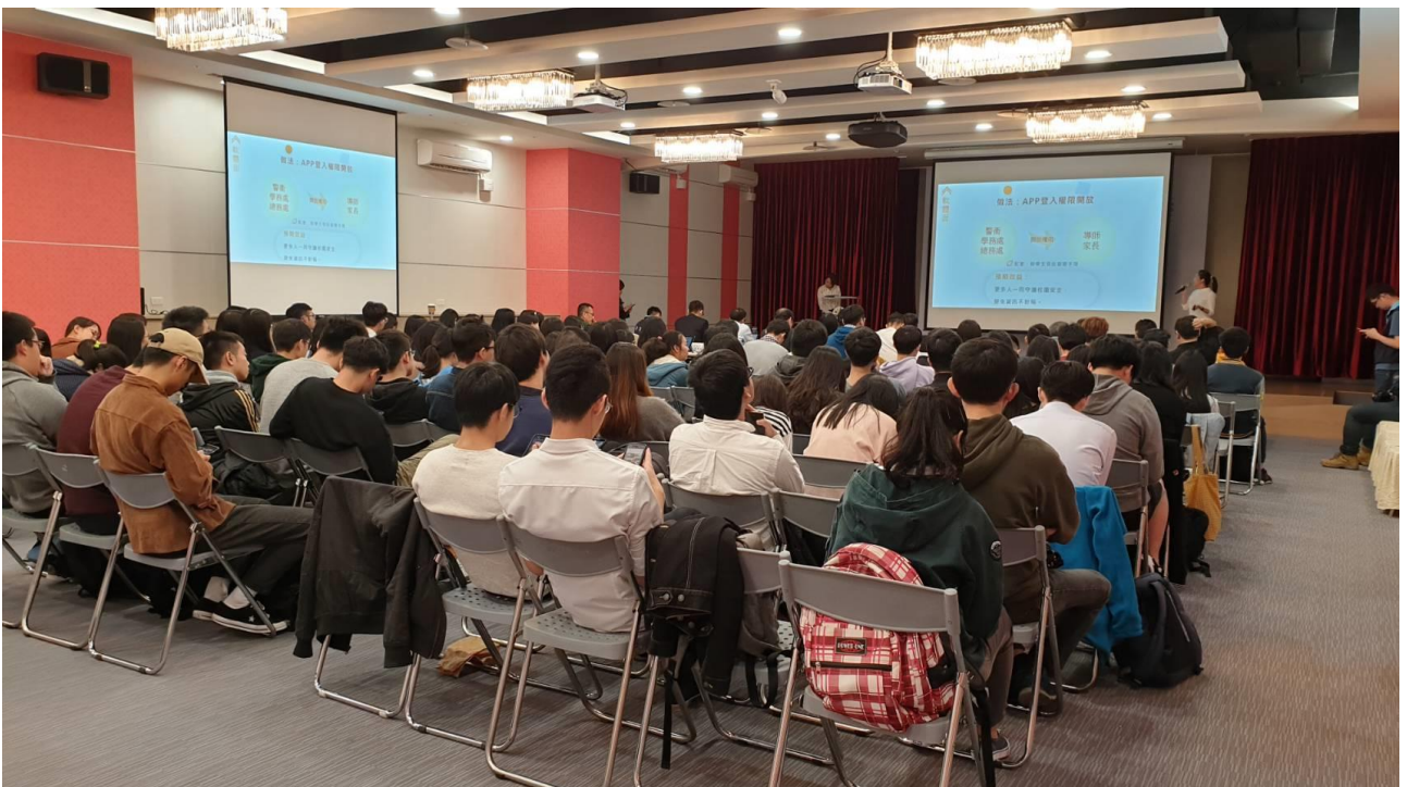
資訊局舉辦公民參與課程合作簡報競賽，現場學生熱烈參與，成果驚豔四座。