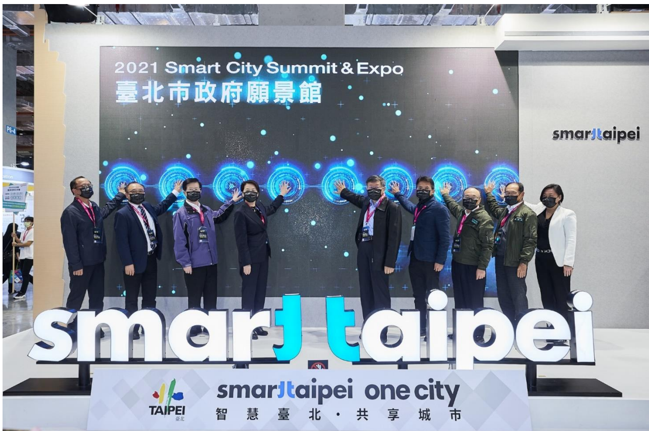
圖2：臺北市府願景館揭幕啟動合影