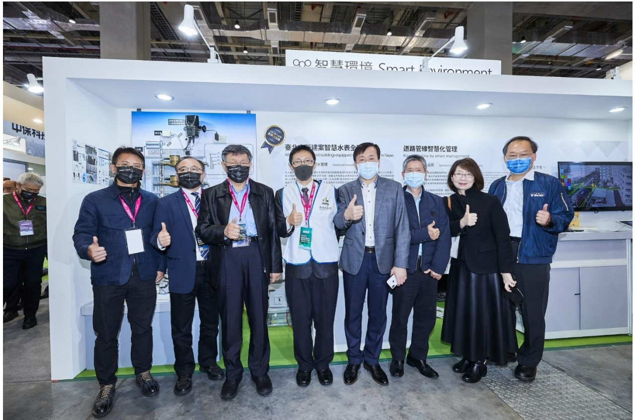
圖7：市長參觀展區(智慧環境-智慧水表)