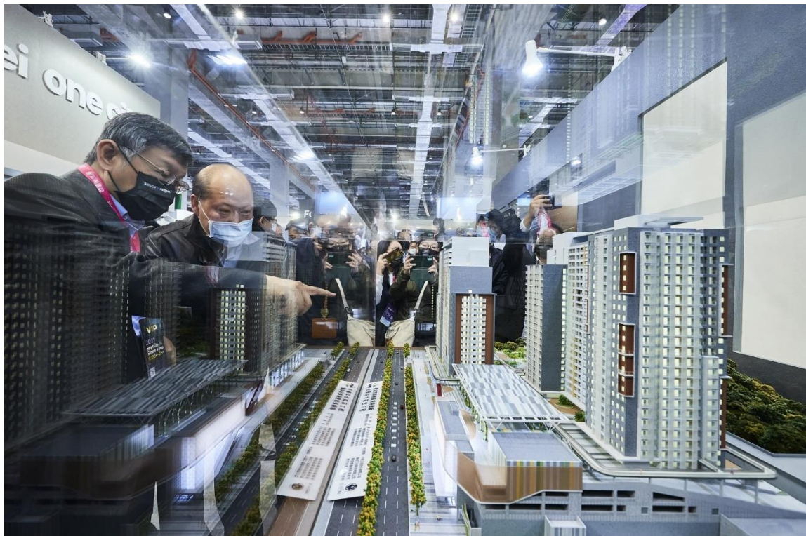
圖10：市長參觀展區(智慧建築-南港機廠社會住宅)