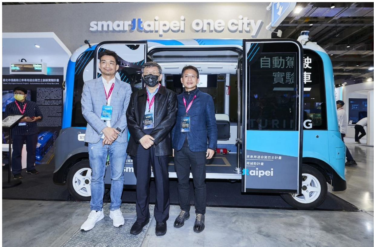
圖8：市長參觀展區(智慧交通-自駕巴士)