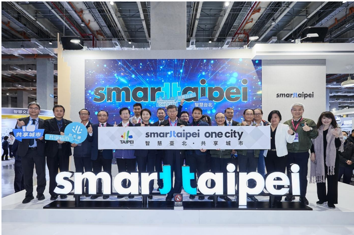
圖3：市府長官於臺北市府願景館前大合照