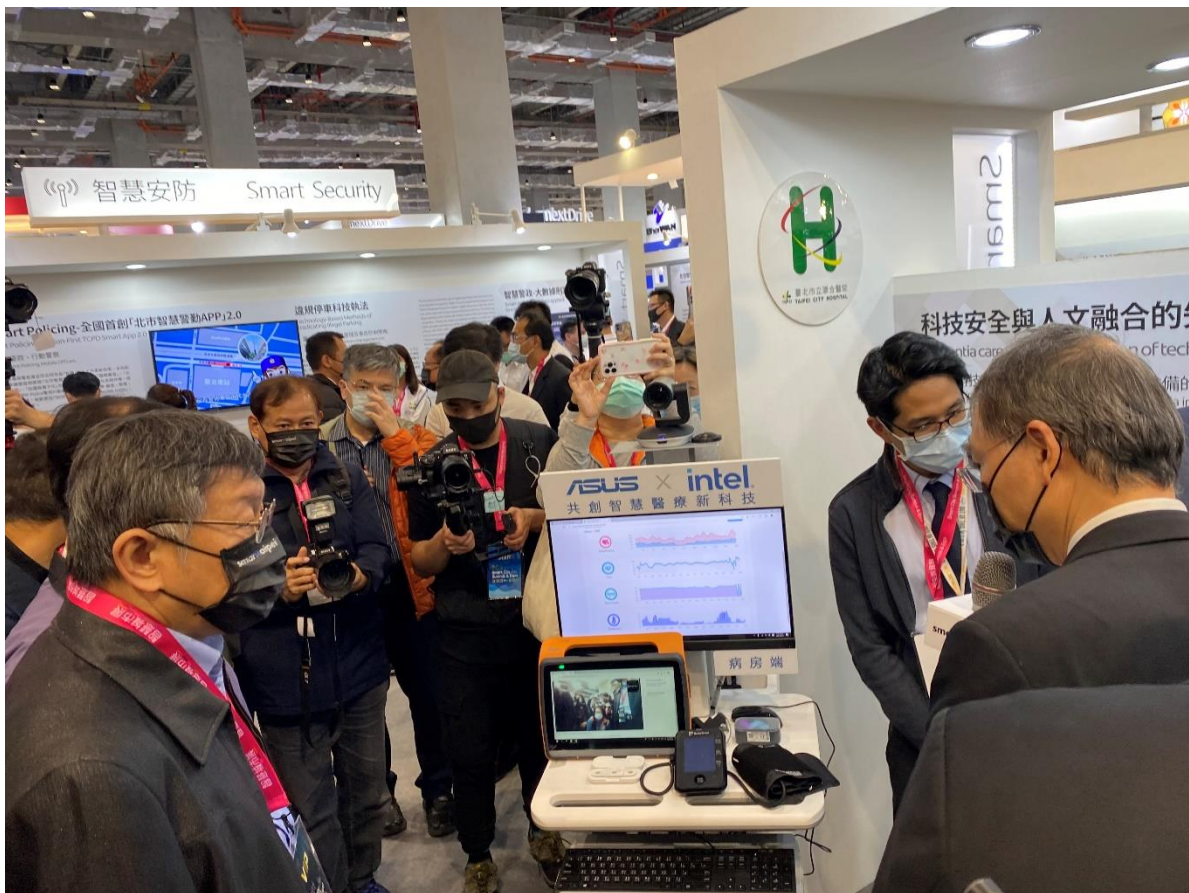
圖12：市長參觀展區(智慧健康-失智症照護)