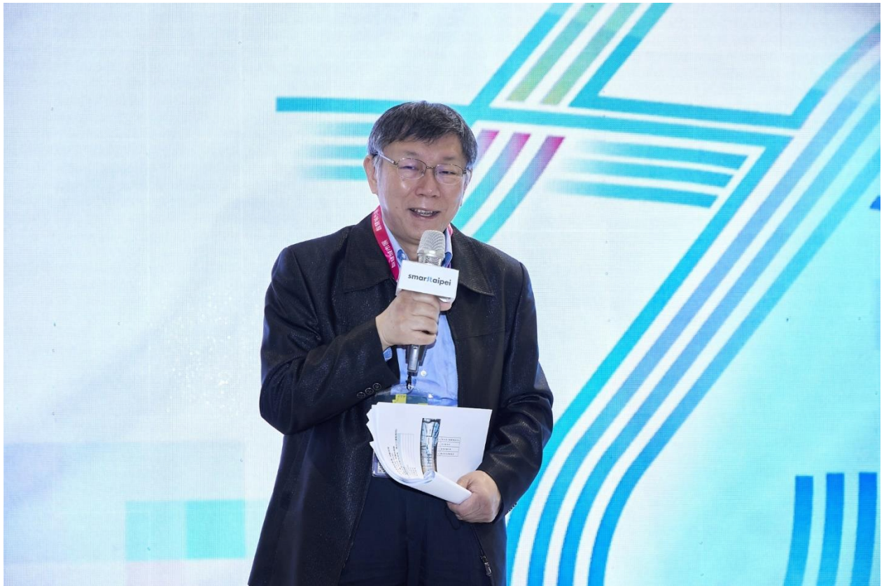
圖1：市長於臺北願景館開幕儀式上致詞