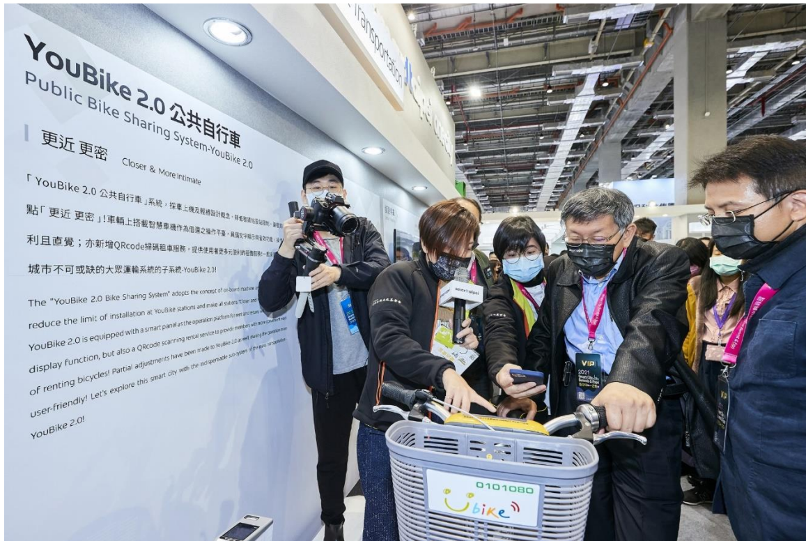
圖9：市長參觀展區(智慧交通-Youbike2.0)