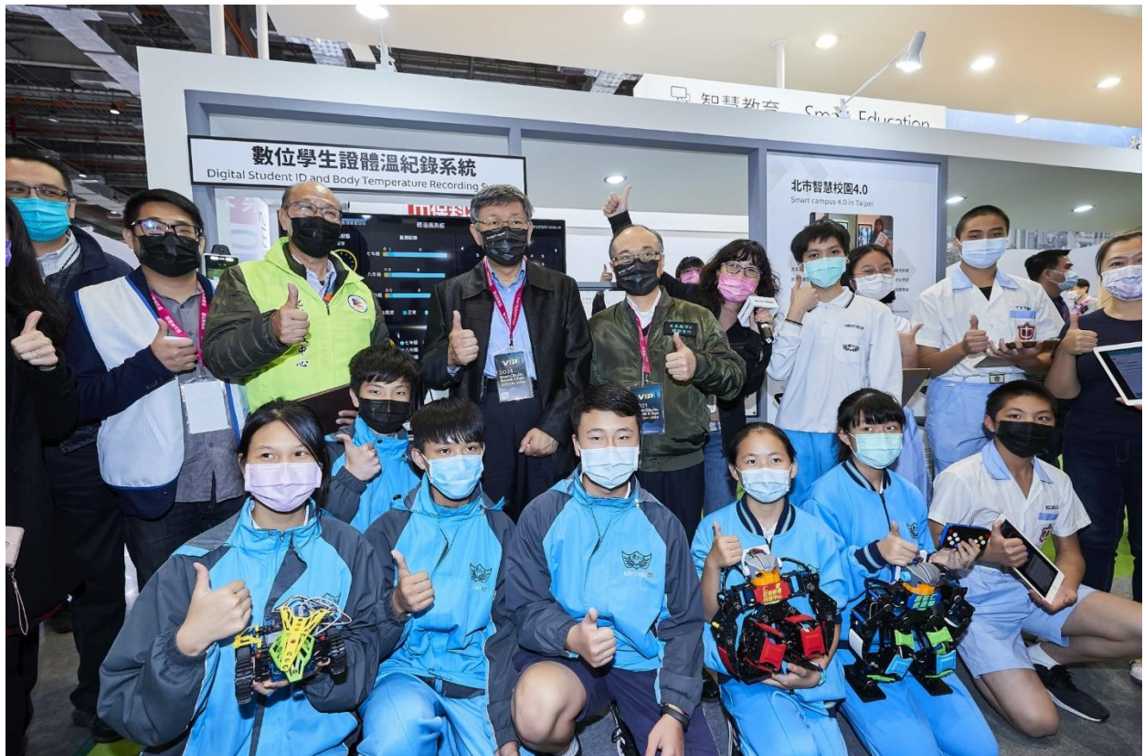
圖6：市長參觀展區(智慧教育-智慧校園)