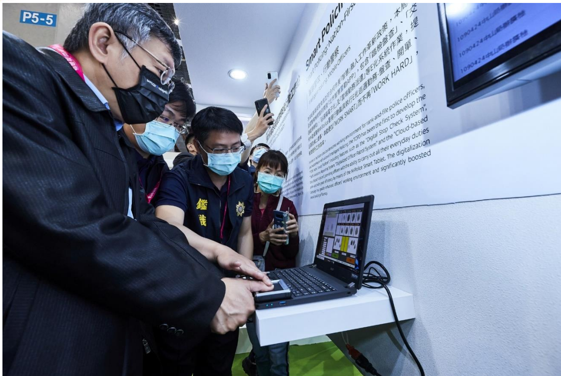
圖11：市長參觀展區(智慧安防-北市智慧警勤)