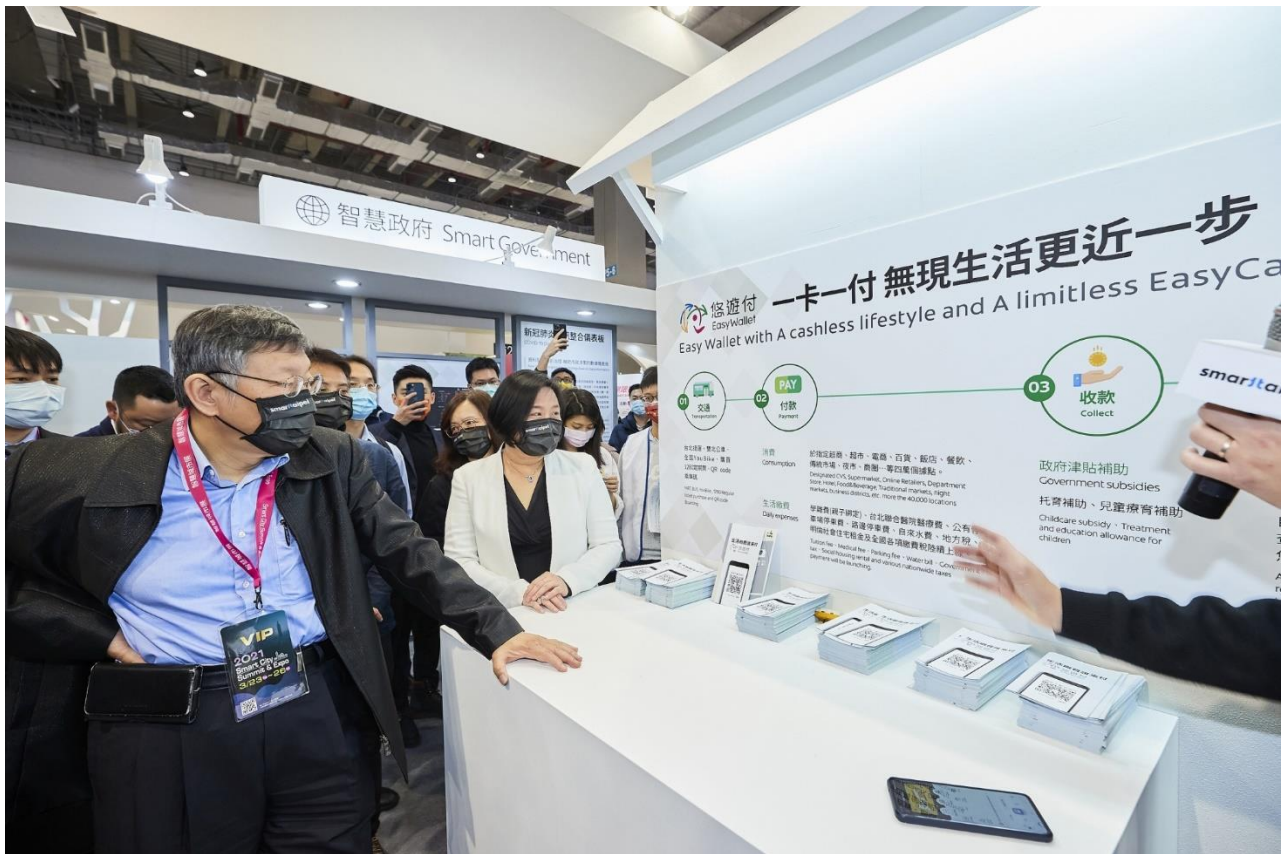
圖5：市長參觀展區(智慧經濟-悠遊付)