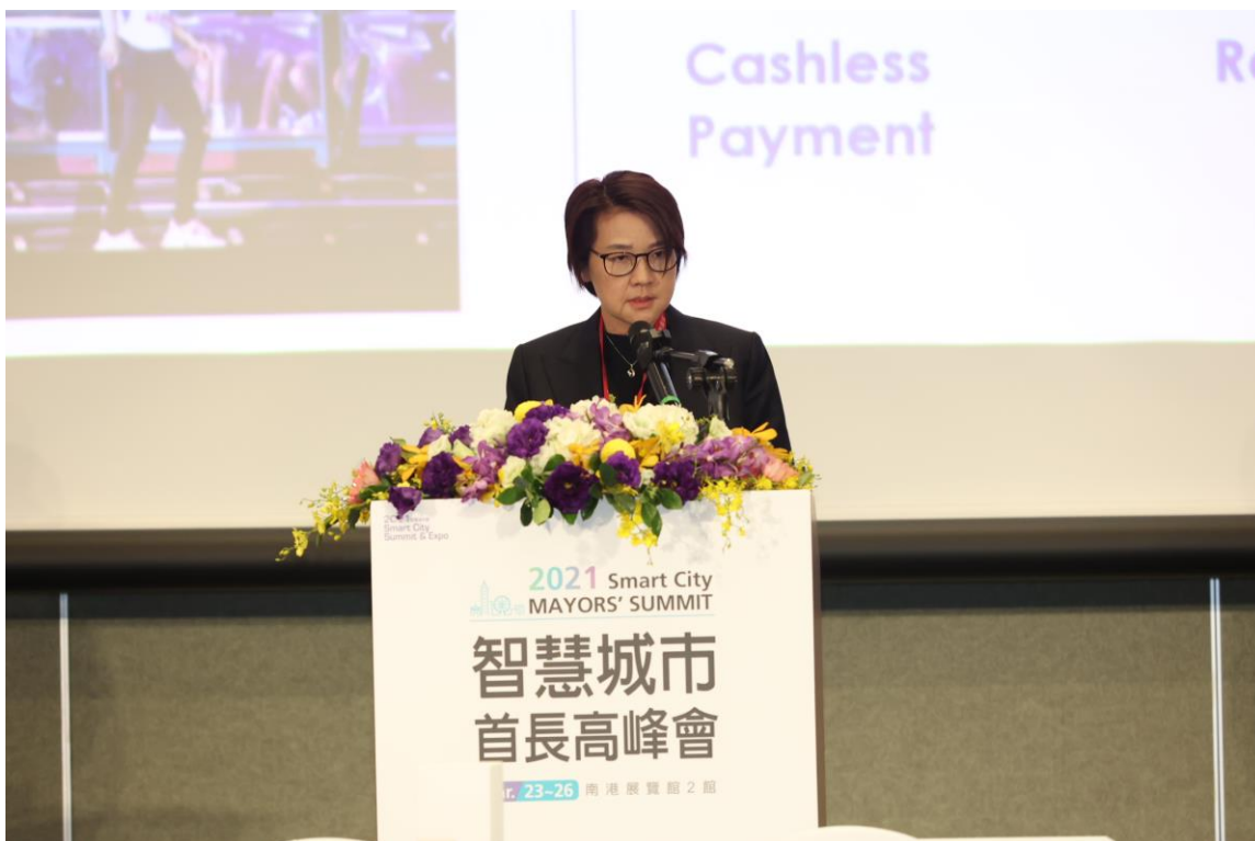
圖2：臺北市副市長黃珊珊與各國城市首長或代表分享國際案例