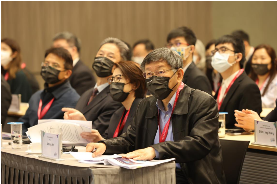
圖5：臺北市政府長官一同參與活動(右至左：臺北市長柯文哲、副市長黃珊珊、市長室涉外事務總監周台竹、資訊局局長呂新科)