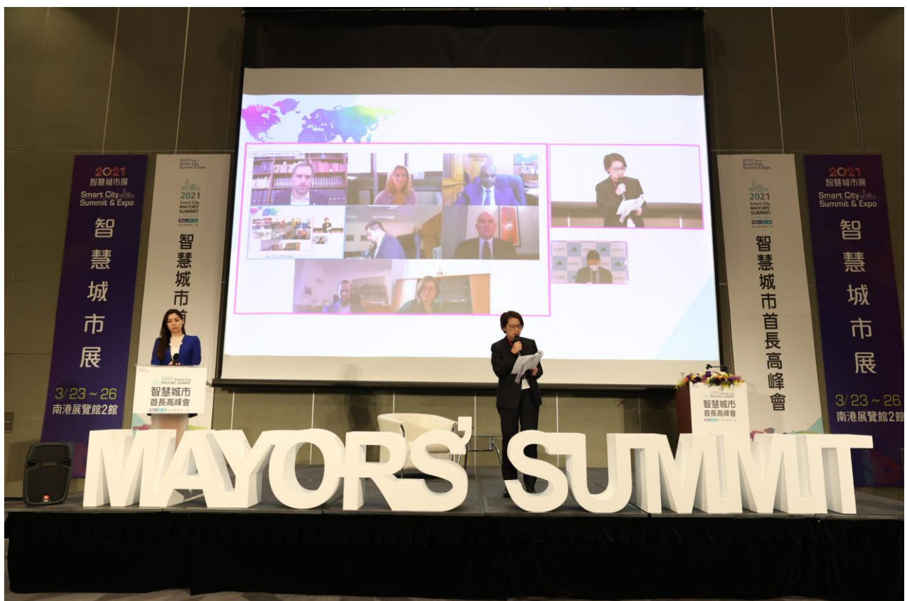
圖6：2021首長高峰會現場