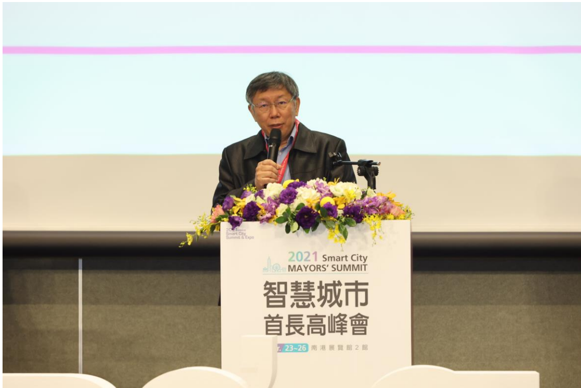
圖1：臺北市長柯文哲於2021首長高峰會發表專題演講