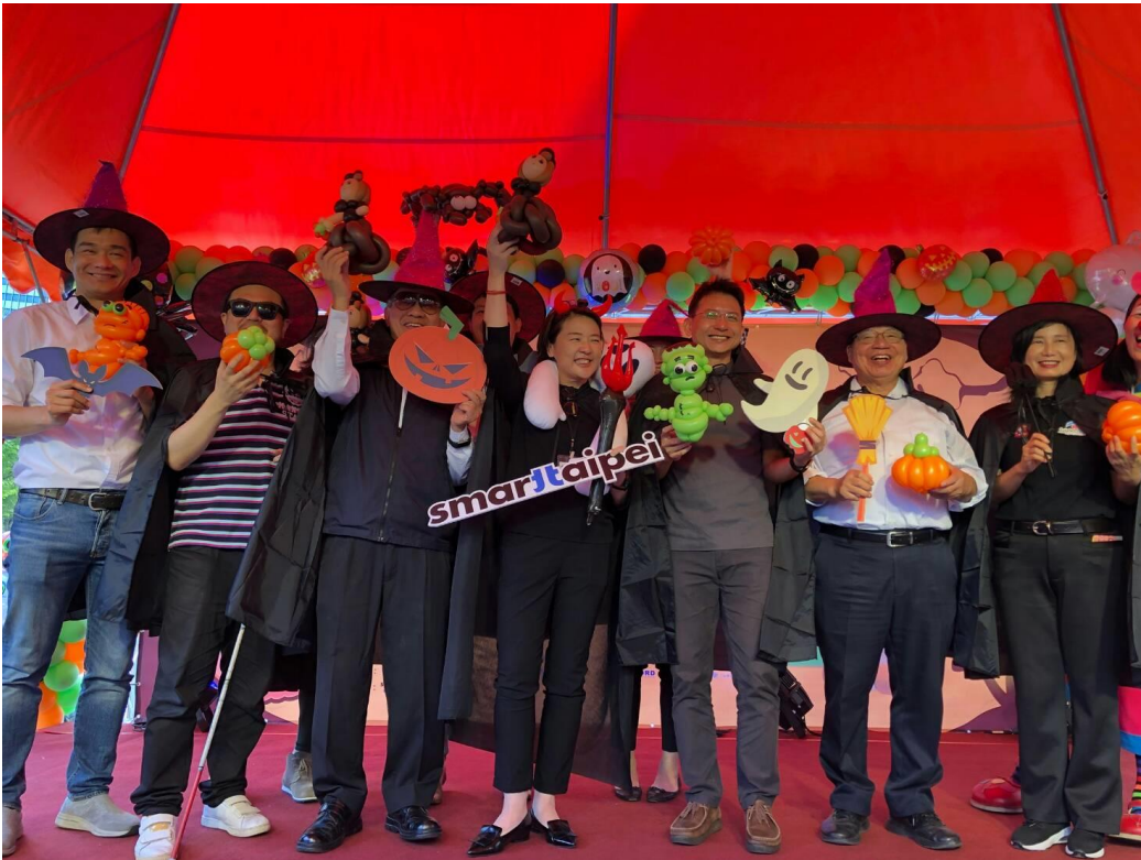
智慧城市成果 showtime 萬聖節大合影

什麼鬼?!」FB 活動專頁： https://www.facebook.com/events/3075912692549437/