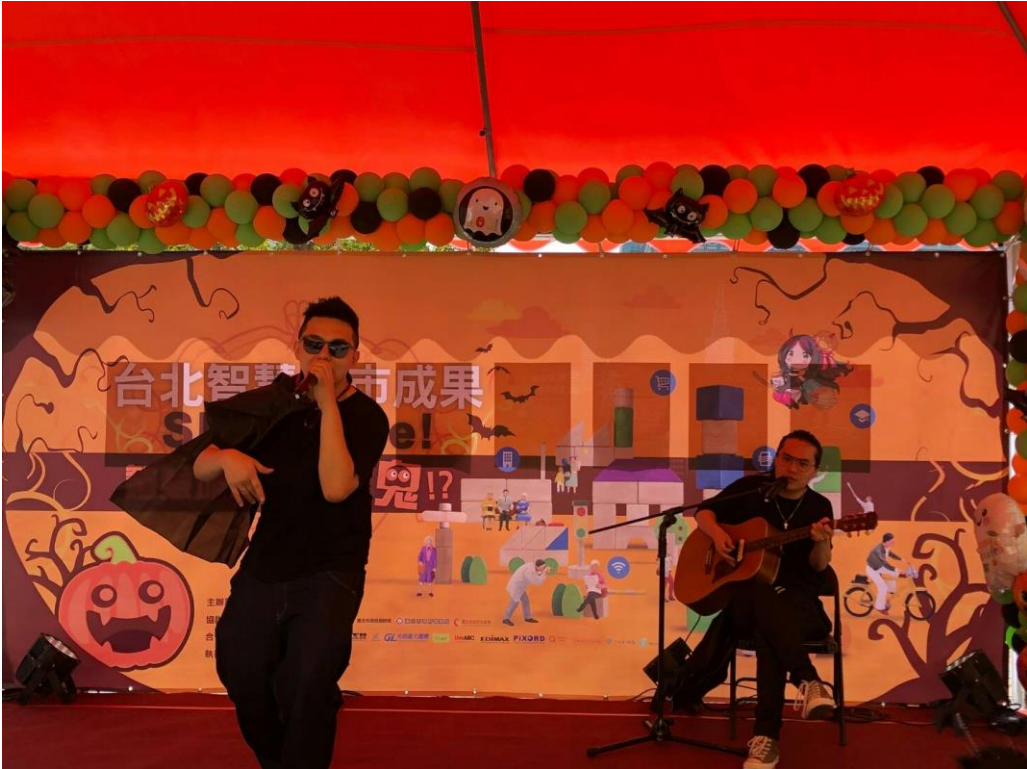
饒舌歌手哈士奇 Rap 表演