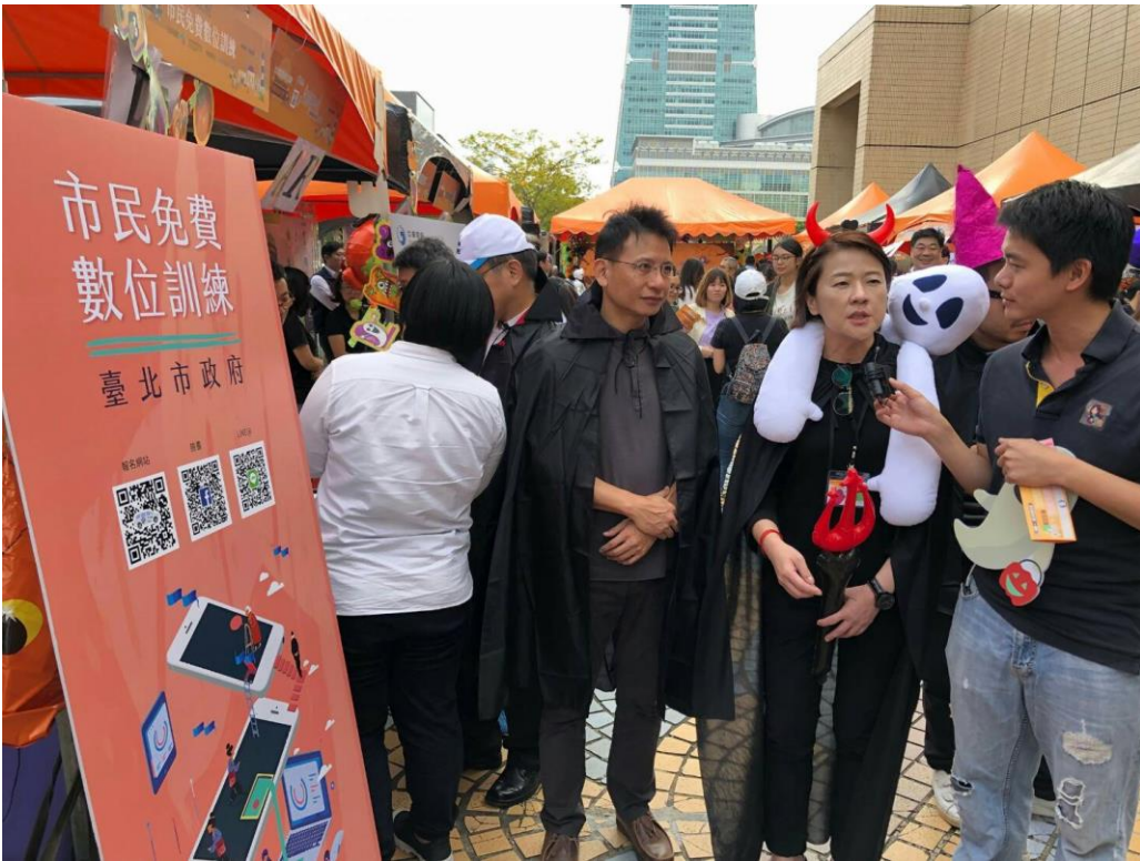
麥客哥哥(右 1)直播導覽介紹北市智慧城市成果