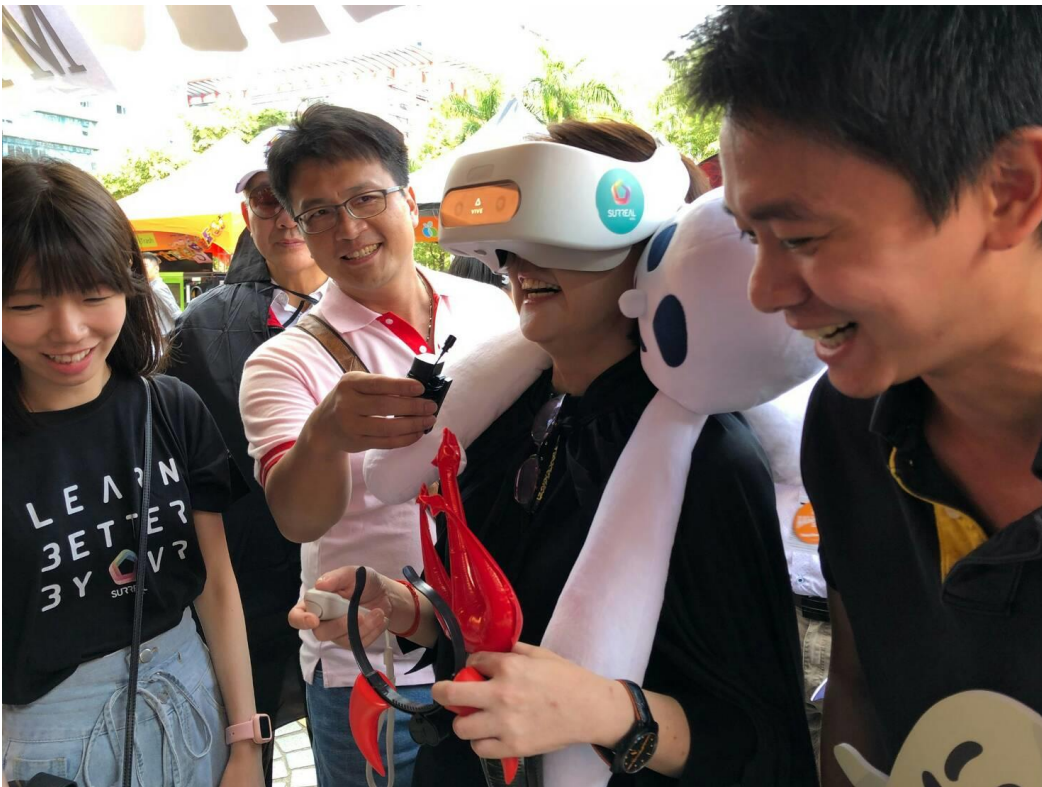
黃副市長珊珊現場體驗智慧應用服務