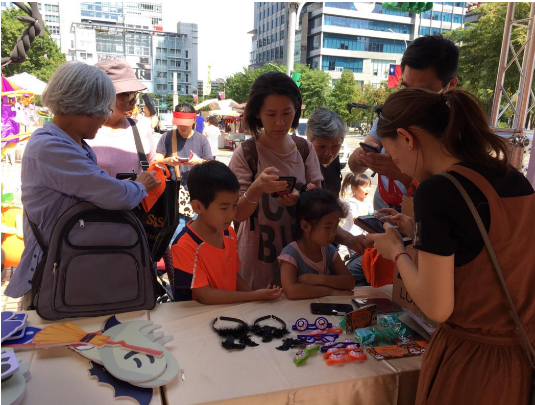
變裝拍照、打卡深受民眾歡迎