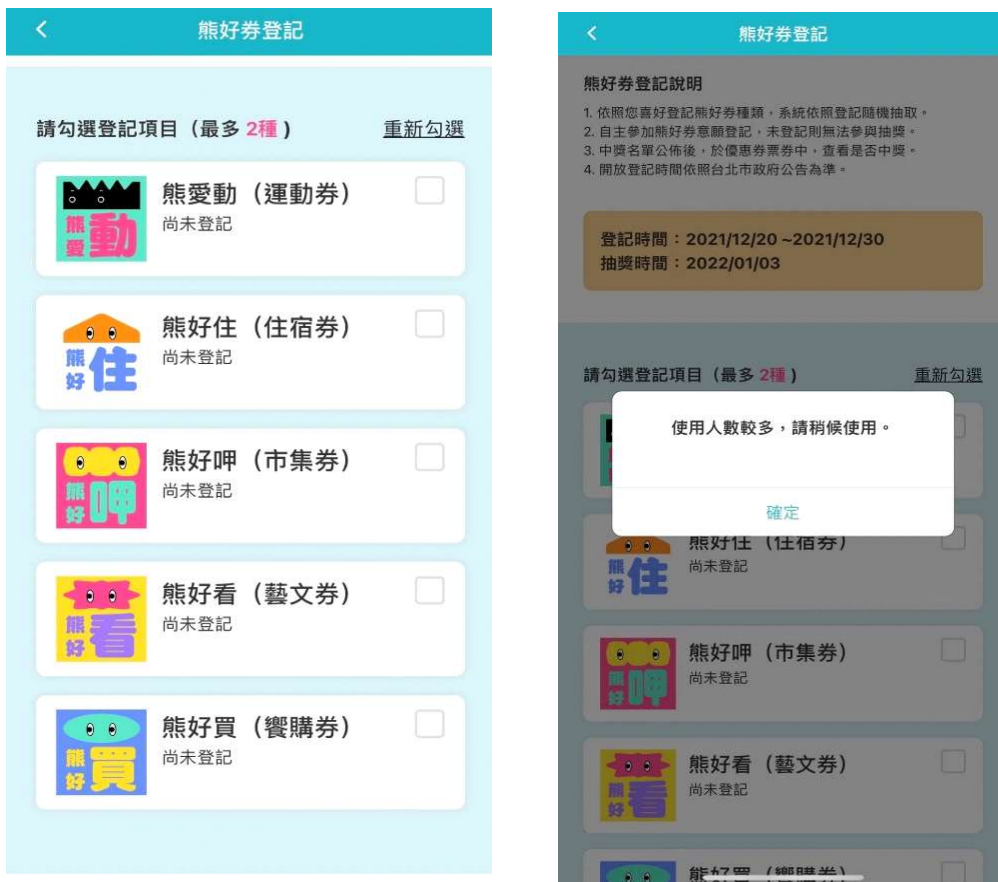
圖2：熊好券登記執行流量控管，故有排隊等候之提示