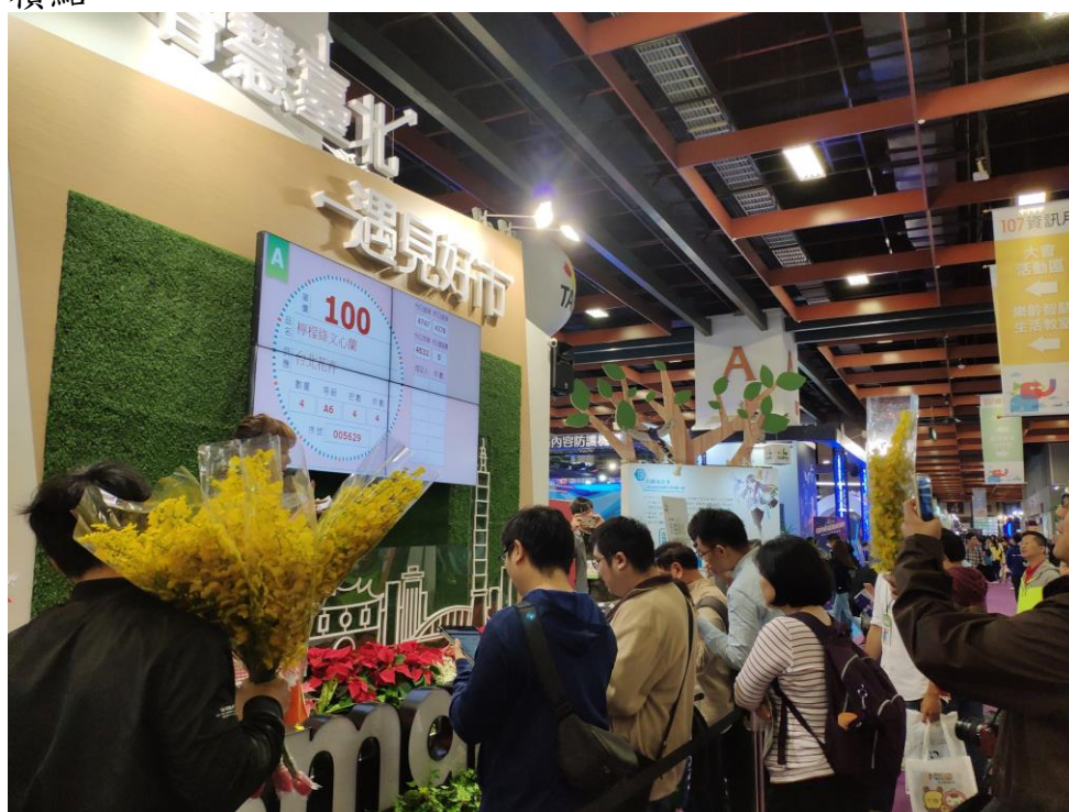
民眾踴躍參加舞台活動，現場正在進行花卉電子競價拍賣情形。