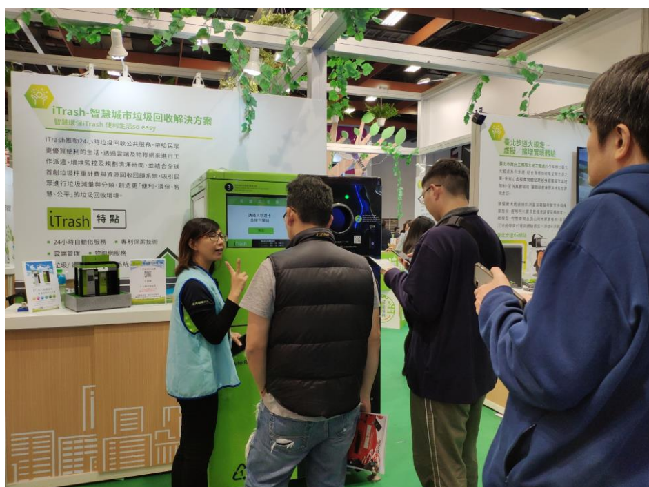
民眾參觀「iTrash 智慧垃圾回收整合系統」，一邊聽解說、一邊體驗做環保、賺積點。