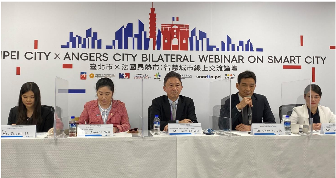
圖1：〈臺北市×法國昂熱市：智慧城市線上交流論壇〉臺北市現場照