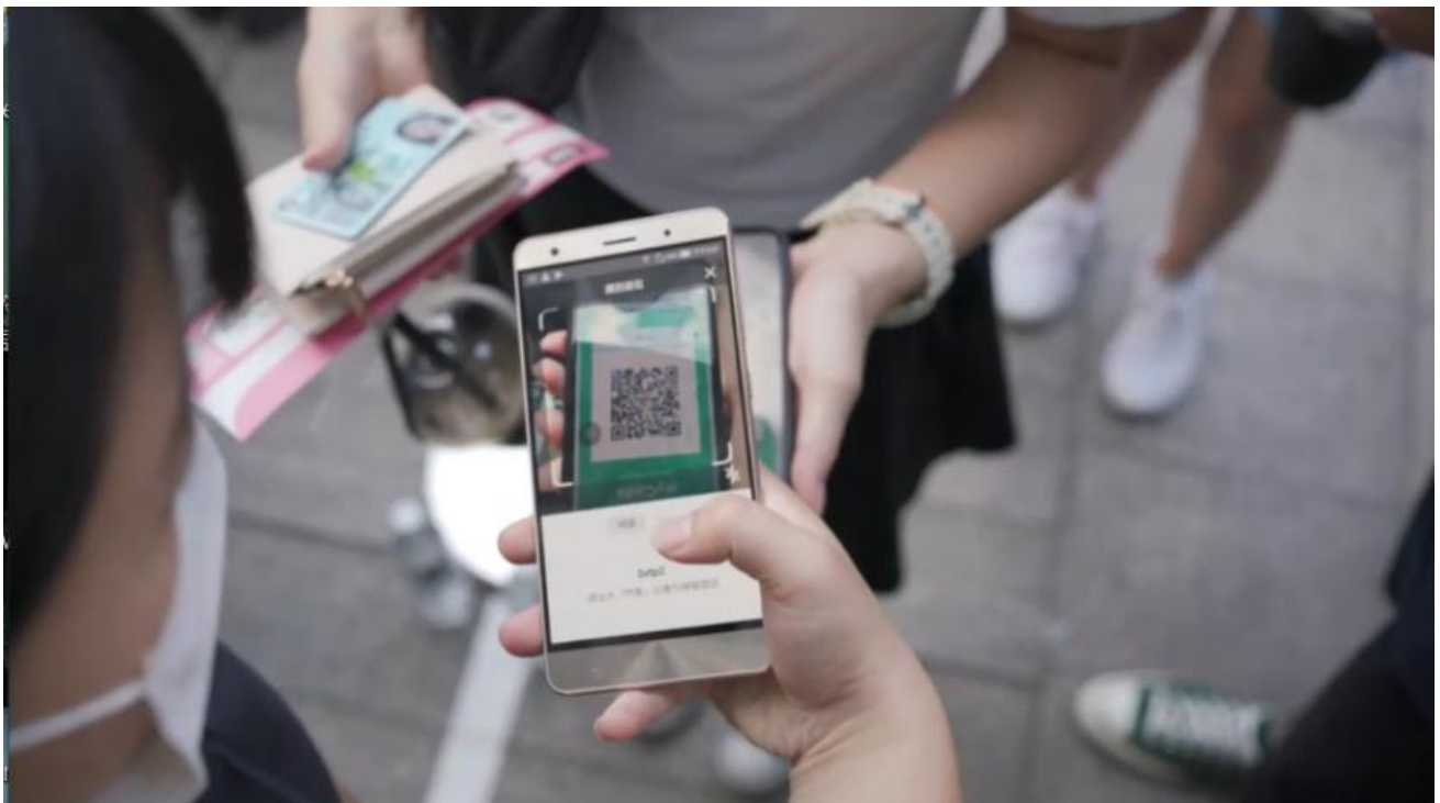
圖2：工作人員掃描隨行碼以進行實聯(名)制