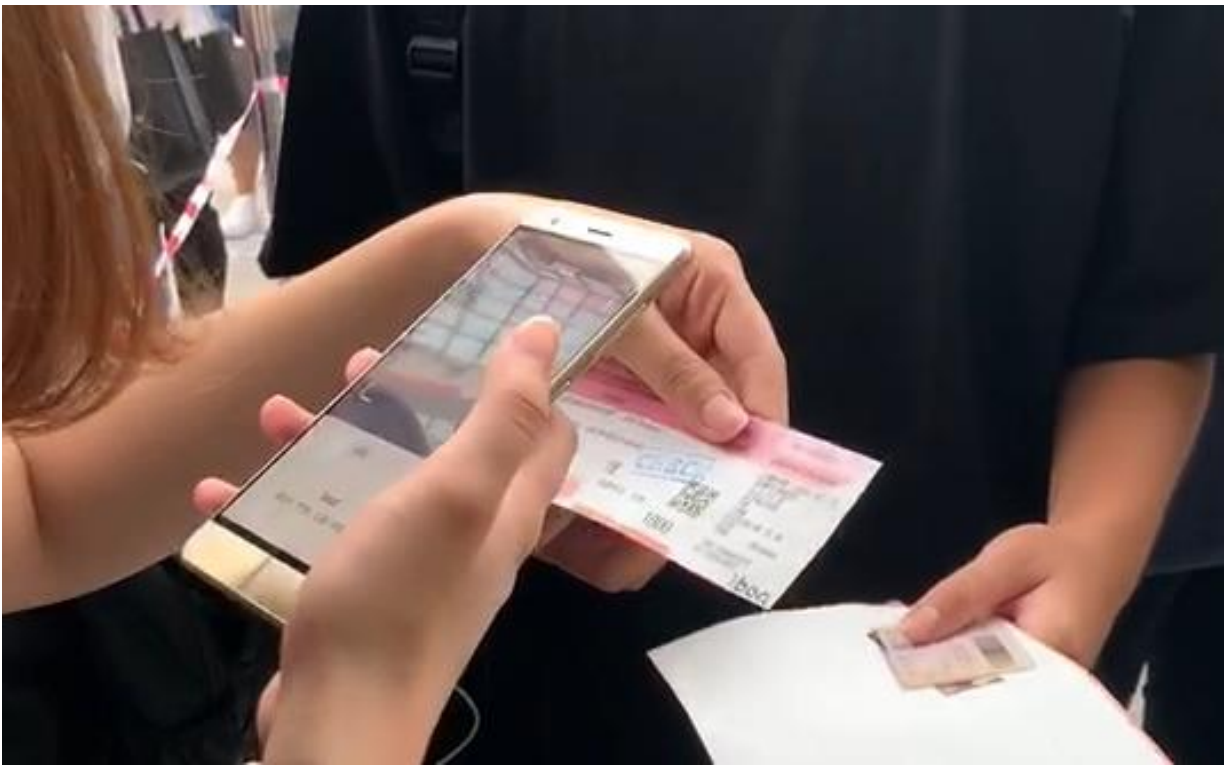
圖3：工作人員掃描門票上之 QR CODE 以記錄觀眾座位