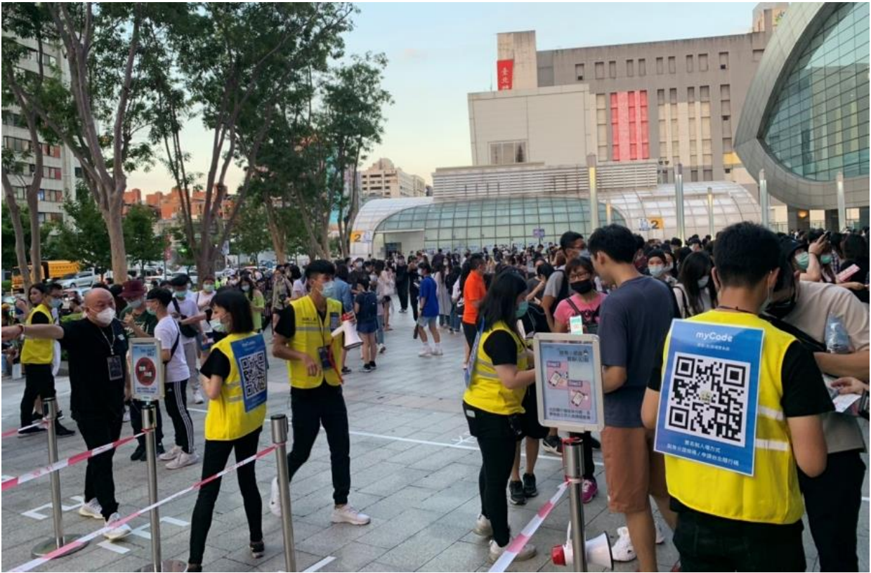
圖1：工作人員於入場前宣導出示身分證或申請隨行碼(myCode) 已完成實聯(名)制入場