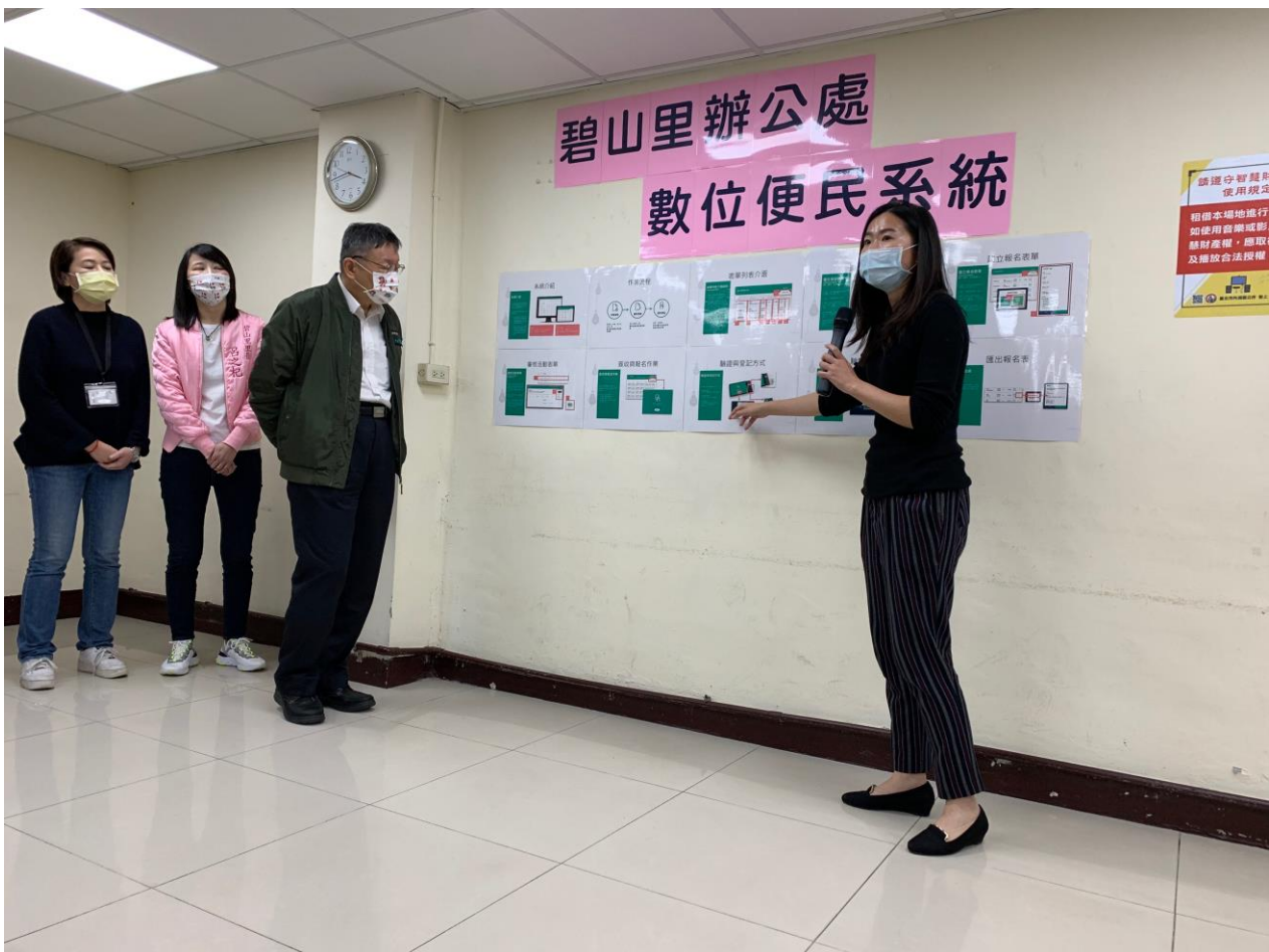
圖1：資訊局同仁說明數位便民系統

未來系統會持續朝數位便民方向前進，預計增加疫苗接種報到、銀髮補助、發放回饋金、長青樂活、守望相助巡邏等，後續北市府會依據試辦成果持續滾動性修正，提供更完善的服務內容及體驗，有效提升市民生活便利性與公部門行政效率。