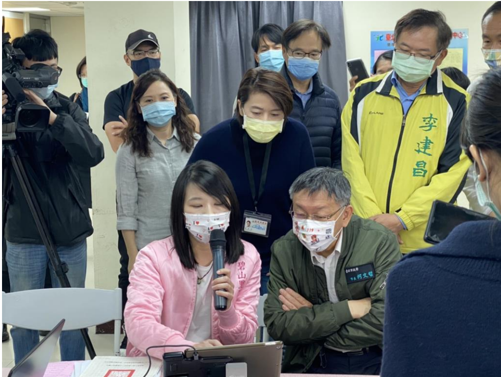
圖2：碧山里呂之杞里長向柯文哲市長、黃珊珊副市長、李建昌議員介紹數位便民系統使用方式