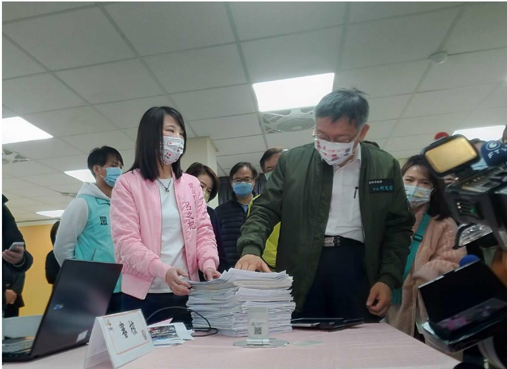
圖4：過去用紙本登記，現今只需使用平板操作