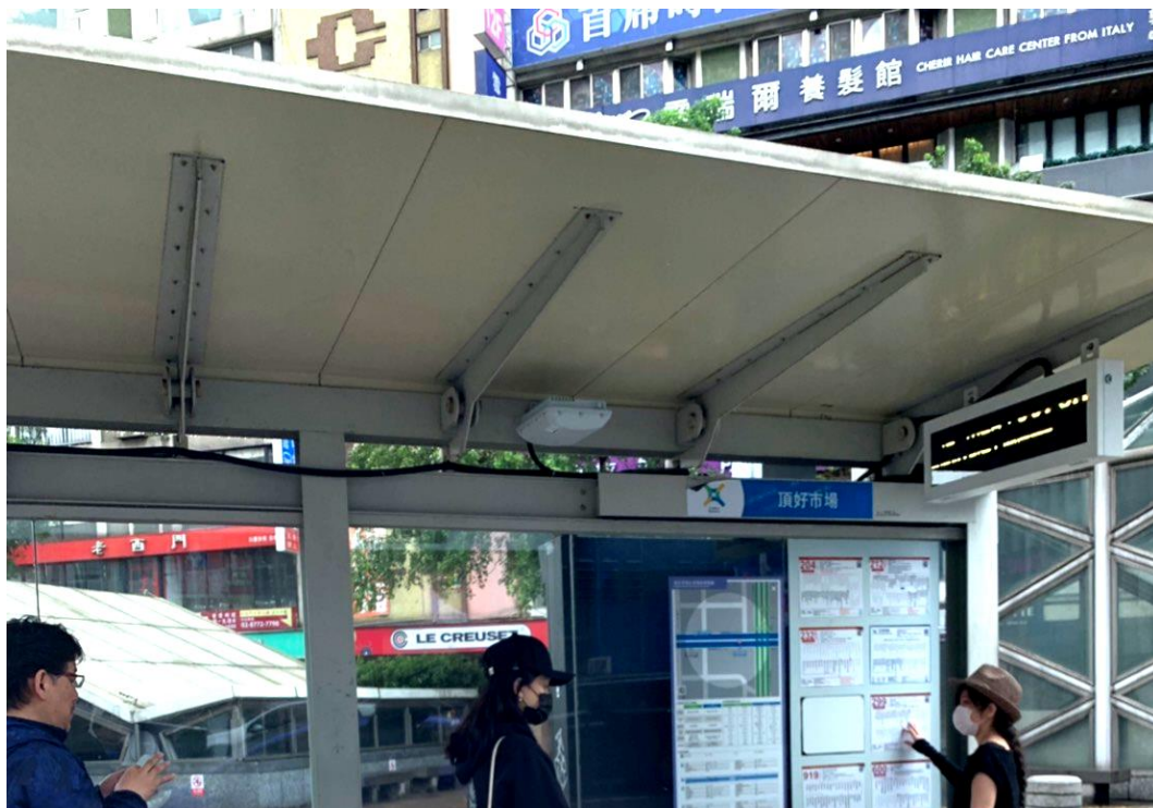
圖 1：民眾使用 Taipei Free 情形