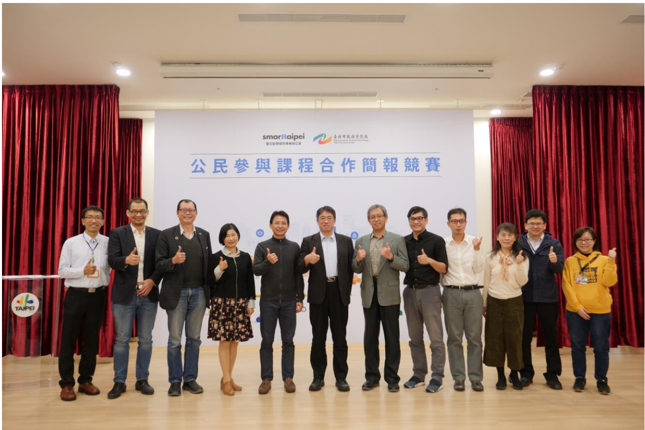
公民參與課程合作簡報競賽全體評審及貴賓大合照。