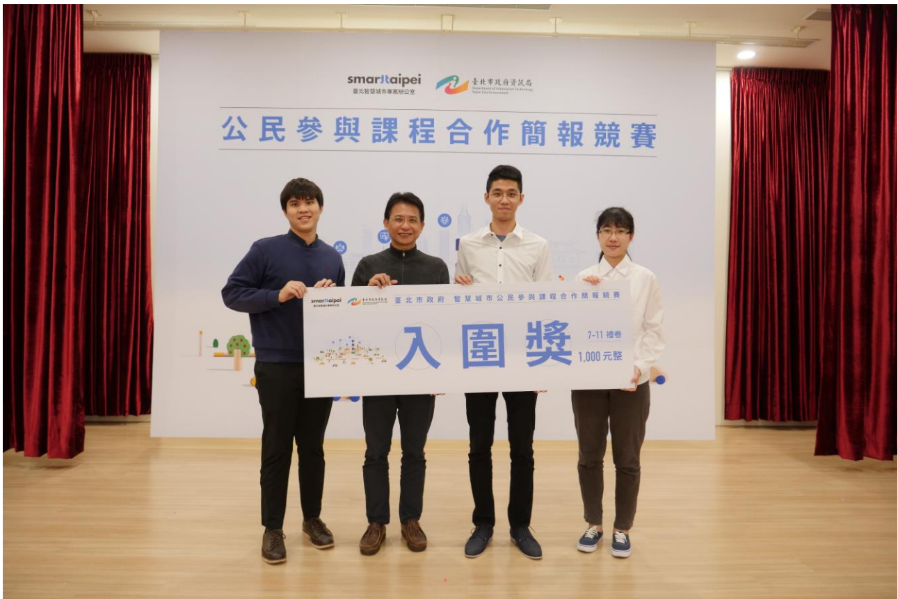
呂新科局長上台頒發公民參與課程合作簡報競賽入圍獎學生組別。