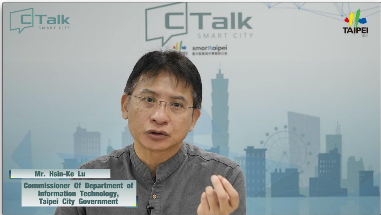
Mr. Hsin-Ke Lu Commissioner Of Department of Information Technology, Taipei City Government