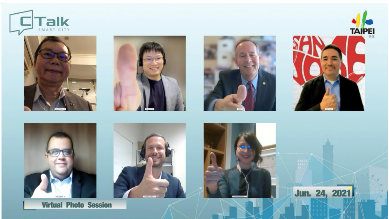
圖6：【2021智慧城市首長高峰會線上論壇 Session 3：數位治理 II】線上大合