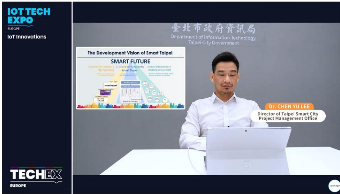
Live: VIRTUAL: Taipei Smart City and PoC practices in IoT Area