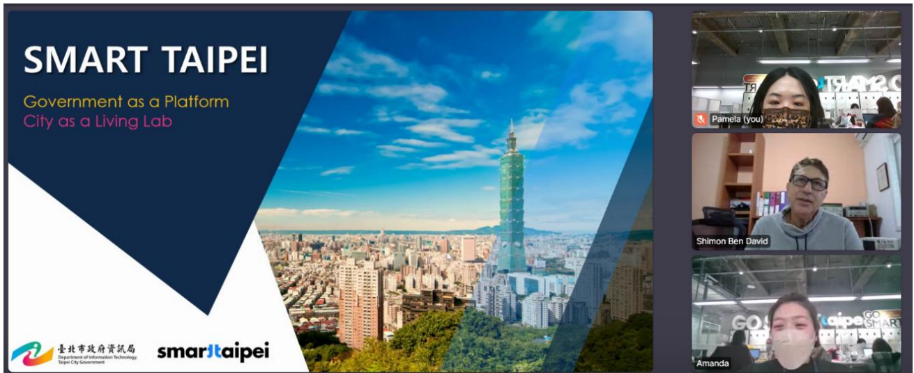
圖3：線上媒合洽談與會以色列業者畫面