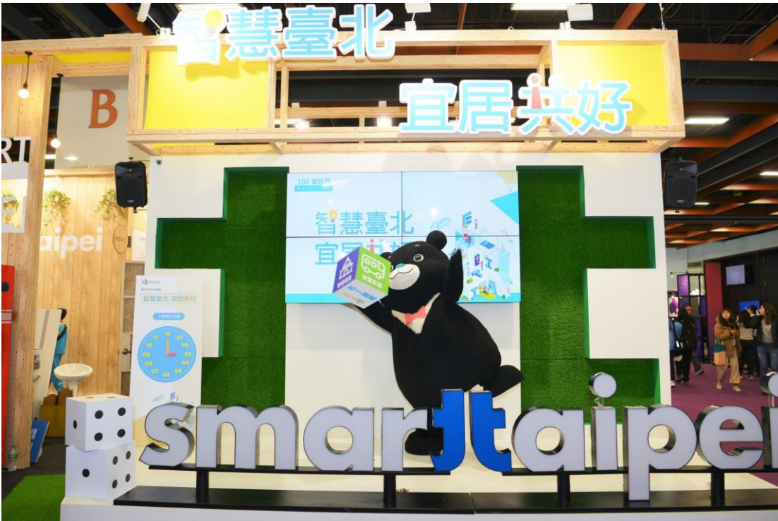
熊讚化身大富翁導覽員前往「智慧臺北 宜居共好」主題館出任務