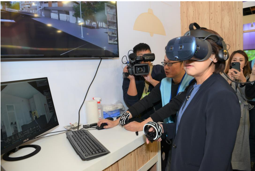
黃珊珊副市長體驗智慧社宅 VR 看屋

其他如智慧創新展區設置「Kiosk 多媒體資訊站」，提供免費使用 Wi-Fi、USB 充電、地圖導覽，以及周邊景點、餐廳、大眾運輸等資訊，提升觀光科技互動體驗。在智慧交通展區方面，展示 iRent 電動機車，參觀者可以體現電動車友善城市的交通城市藍圖，提供民眾綠色運輸更多的選擇。民眾於資訊月展覽期間加入「智慧臺北 宜居共好」LINE@，可立即接收展館活動資訊，更多好康請持續關注【台北市政府資訊局】臉書。