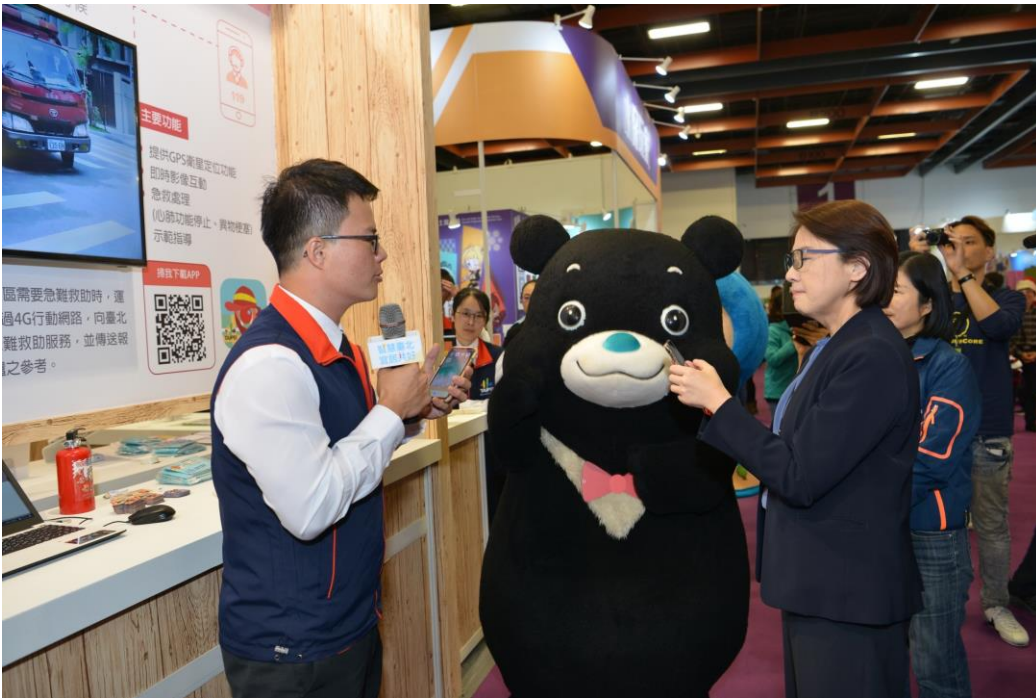
熊讚跟黃副市長一起參觀展區各項創新服務，深獲大小朋友喜愛