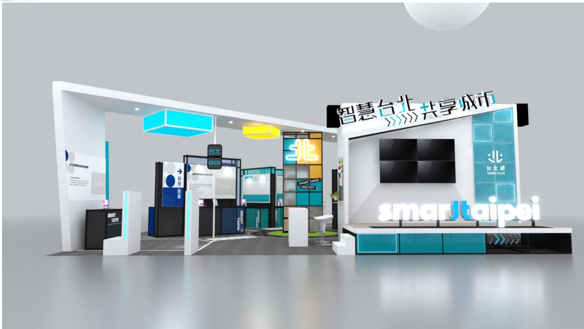
圖 2：臺北市政府主題館「智慧台北 共享城市」示意圖