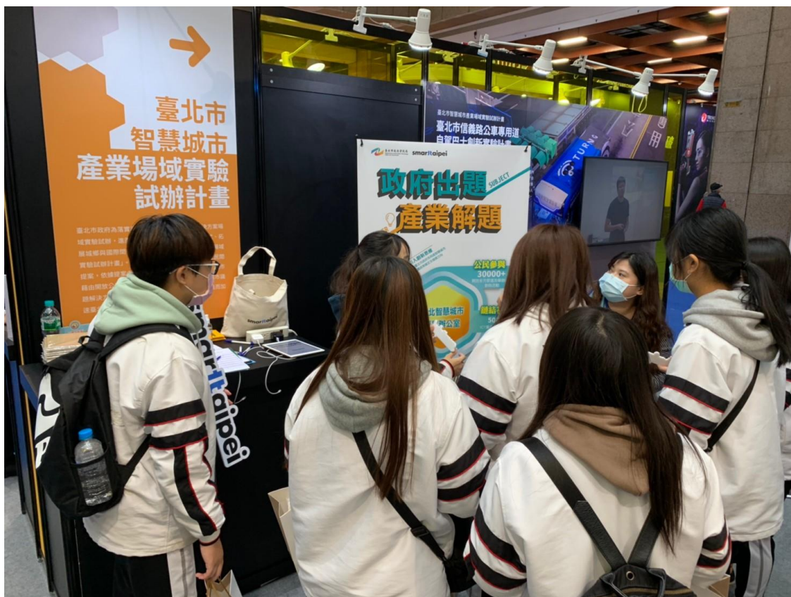
圖 3：學生團體來到展區聽工作人員解說