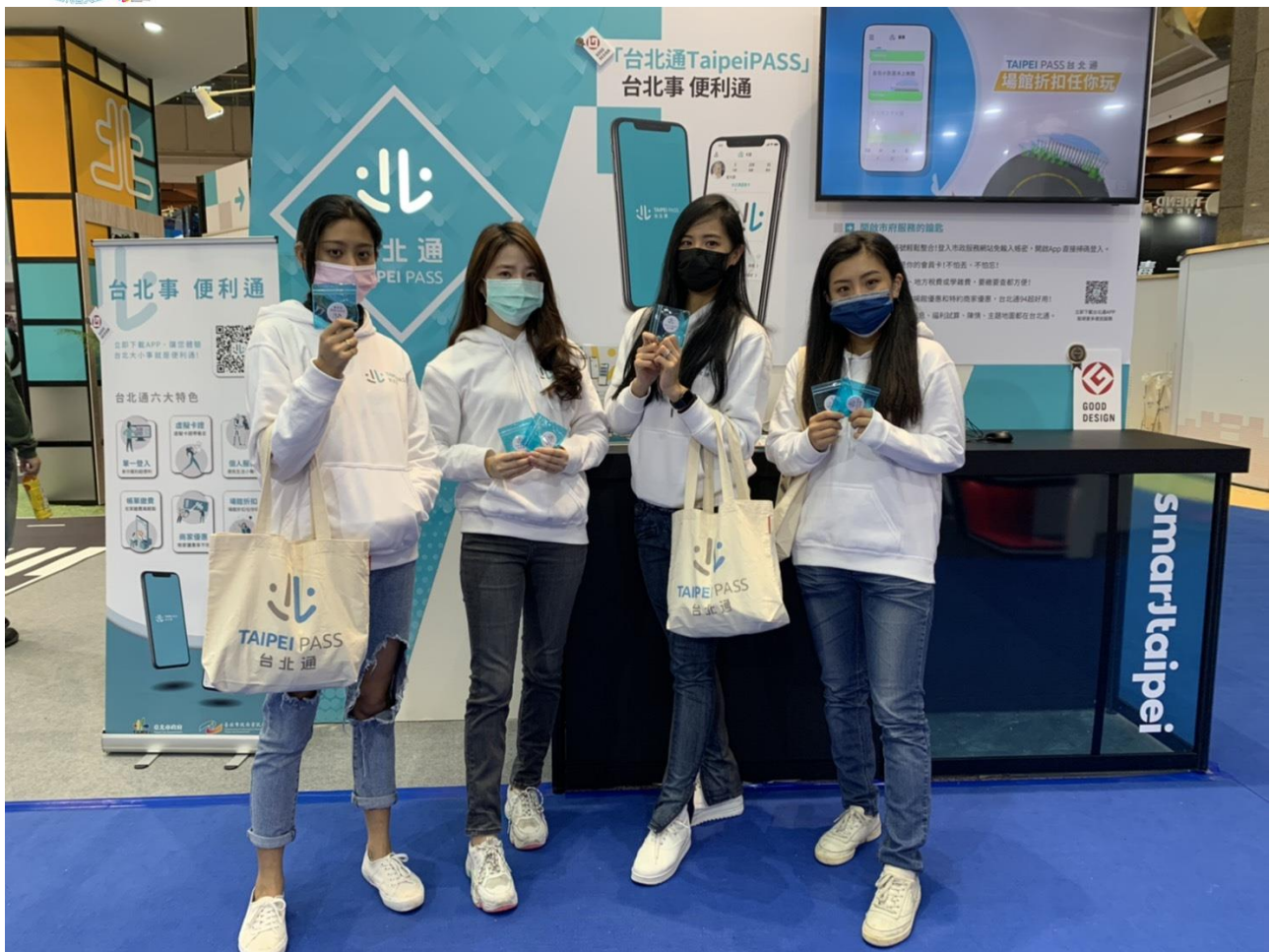
圖 6：台北通 TaipeiPASS 展示區