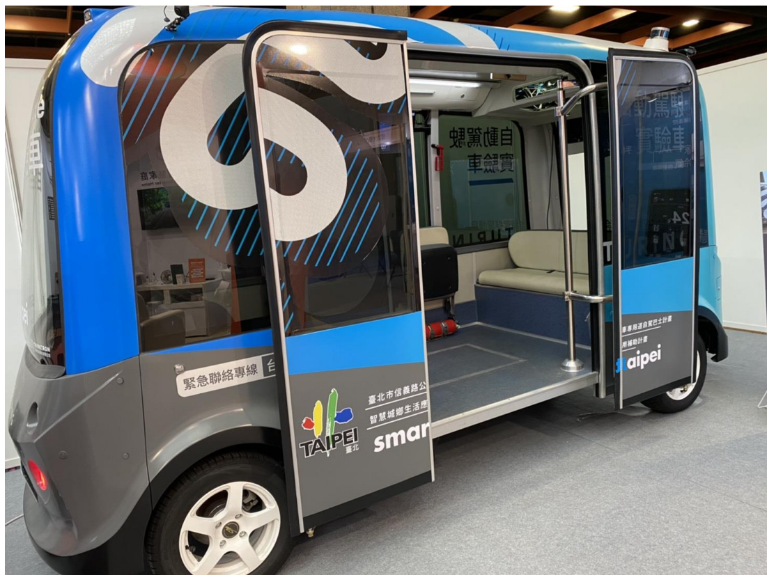
圖 5：自駕巴士於展館展示