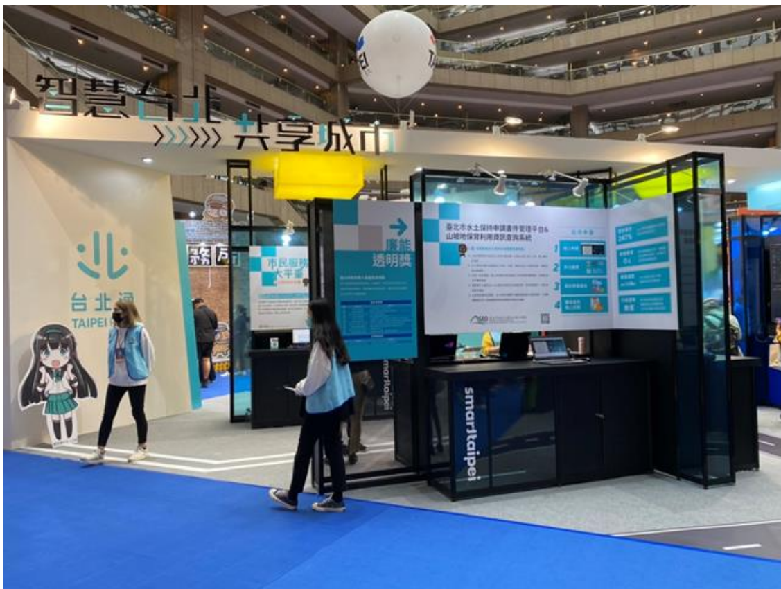
圖 1：109 資訊月「臺北市府館」－智慧台北・共享市場館面貌

另外，現場請民眾填寫「有感的智慧應用及領域」問卷，深入了解民眾關心的議題及想法，提供精美小禮物，時間至12月6日止，歡迎民眾趁著假日踴躍前往資訊月主題館免費參觀體驗「智慧臺北 共享城市」拿好康。