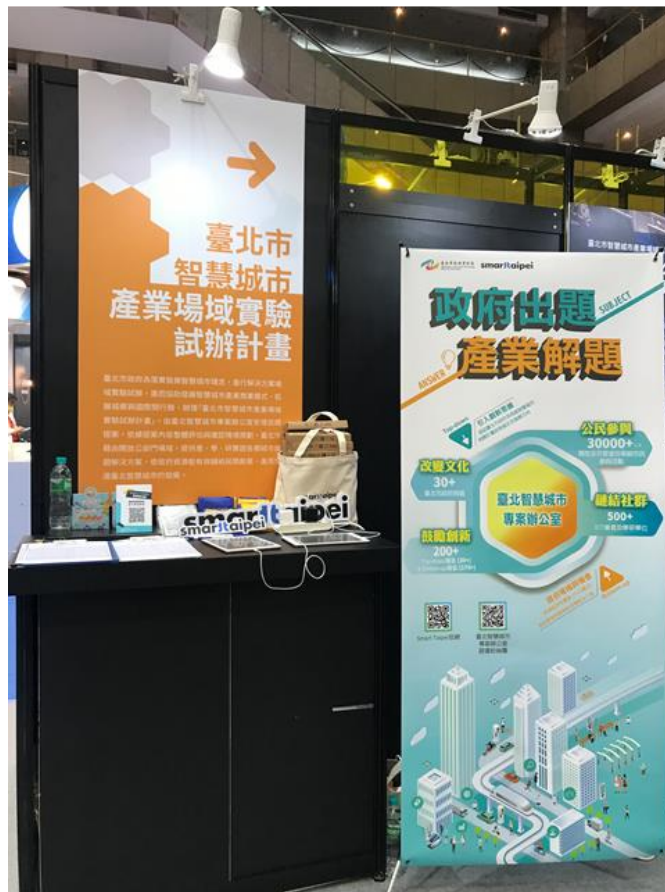
圖 2：109 資訊月「臺北市政府館」－智慧城市產業場域實驗室辦計畫