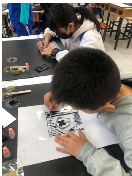
說明：學生聚精會神創作藍曬圖