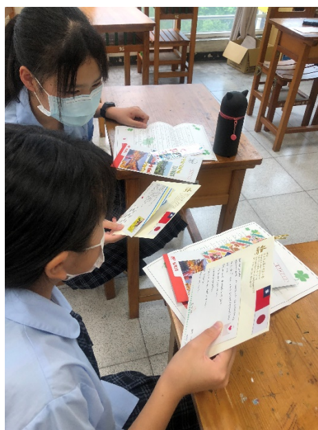
說明：學生彼此交流自己與筆友的書信內容