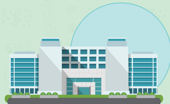
地方政府消費者服務中心