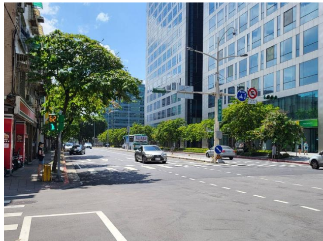
圖 2 改善後